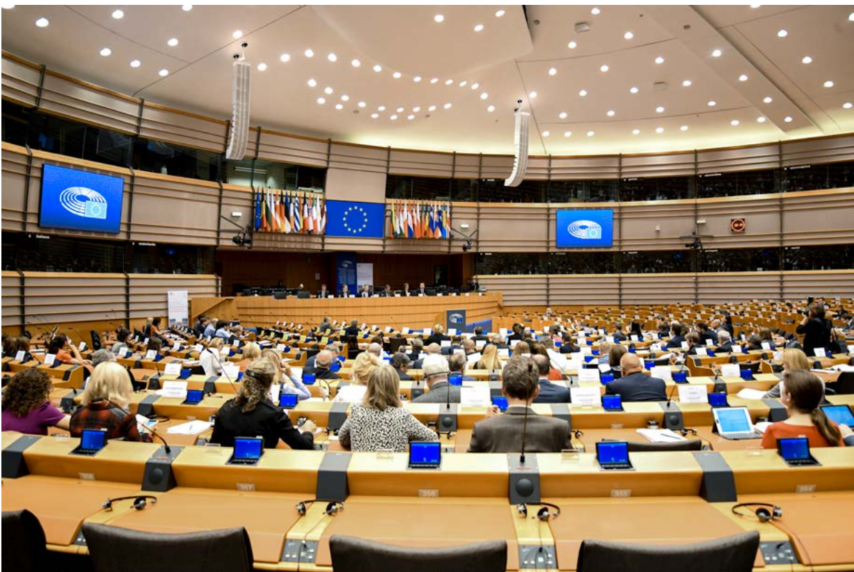
Tretia schôdza JPSG pre Europol – prezentácia priorít spoločnej parlamentnej kontrolnej skupiny predsedníckou trojkou 2018 – 2019

Spoločná parlamentná kontrolná skupina organizuje dve schôdze ročne: v prvej polovici roka v parlamente krajiny, ktorá zastáva rotujúce predsedníctvo Rady EÚ, a v druhej polovici roka v Európskom parlamente.