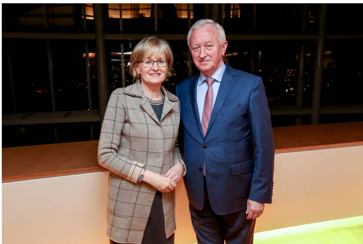
Podpredsedníčka Mairead McGuinness a podpredseda Bogusław Liberadzki

V súlade s Lisabonskou zmluvou boli národné parlamenty spolu s Európskym parlamentom poverené úlohou kontroly a dohľadu v oblasti spravodlivosti a vnútorných vecí, najmä pokiaľ ide o Europol a Eurojust. Práca spoločnej parlamentnej kontrolnej skupiny (JPSG) pre Europol, ktorá bola zriadená v roku 2017, bola významným novým vývojom medziparlamentnej spolupráce. Jej hlavnou úlohou je politické monitorovanie činnosti Europolu pri plnení jeho úloh v čase, keď sa úloha Europolu v boji proti terorizmu a organizovanej trestnej činnosti stáva čoraz dôležitejšou.