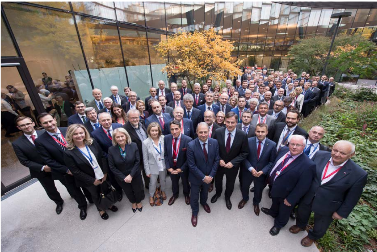
Medziparlamentná konferencia pre spoločnú zahraničnú a bezpečnostnú politiku (SZBP) a spoločnú bezpečnostnú a obrannú politiku (SBOP) vo Viedni, 11. – 12. október 2018

V roku 2018 sa 12. medziparlamentná konferencia pre SZBP a SBOP konala v Sofii (15. – 17. februára) a 13. medziparlamentná konferencia pre SZBP a SBOP vo Viedni (11. – 12. októbra). Delegácie EP na obidvoch zasadnutiach tvorili členovia Výboru pre zahraničné veci a Podvýboru pre bezpečnosť a obranu a viedol ich predseda Výboru pre zahraničné veci David McAllister.