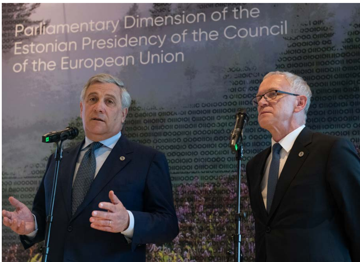
Konferencia predsedov parlamentov EÚ v Estónsku. Predseda EP Antonio Tajani zasadá s predsedom Riigikogu, parlamentu Estónska, Eikim Nestorom

Na výročnom stretnutí konferencie EUSC, ktorá sa konala 23. a 24. apríla 2018 v Tallinne a ktorej predsedal predseda Riigikogu Eiki Nestor, sa zúčastnili predsedovia národných parlamentov EÚ. Na konferencii EUSC sa po prvýkrát zúčastnil nedávno zvolený predseda nemeckého Spolkového snemu Wolfgang Schäuble. Európsky parlament zastupoval predseda Antonio Tajani a podpredseda Bogusław Liberadzki.