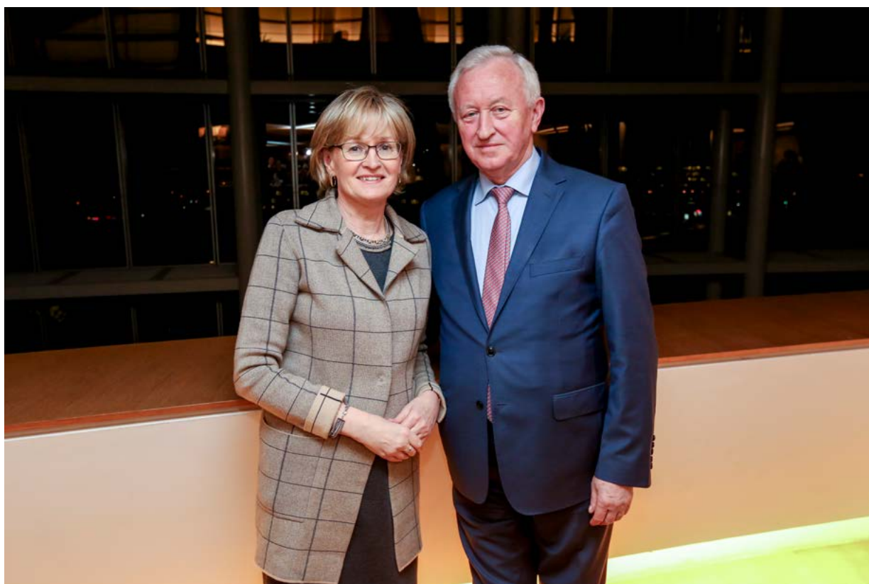
Wiceprzewodniczący Mairead McGuinness i Bogusław Liberadzki

W debatach podczas posiedzeń międzyparlamentarnych koncentrowano się głównie na kwestiach takich jak brexit, budżet UE, migracja, bezpieczeństwo, polityka zagraniczna i polityka obronna, unia gospodarcza i walutowa, ochrona danych, przyszłość produkcji żywności i rolnictwa oraz wybory europejskie. Wymiana opinii między parlamentarzystami z całej UE ma zasadnicze znaczenie dla wzajemnego zrozumienia problemów i wyzwań, a także umożliwia powiązanie perspektyw krajowych ze spojrzeniem europejskim na dane zagadnienia, z myślą o wypracowaniu wspólnych rozwiązań.