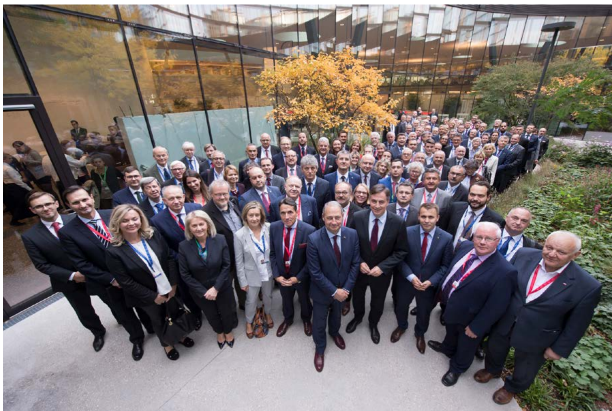
Międzyparlamentarna Konferencja ds. Wspólnej Polityki Zagranicznej i Bezpieczeństwa oraz Wspólnej Polityki Bezpieczeństwa i Obrony w Wiedniu w dniach 11–12 października 2018 r.

W 2018 r. 12. i 13. posiedzenie międzyparlamentarnej konferencji ds. WPZiB/WPBiO odbyło się odpowiednio w Sofii (15-17 lutego) i w Wiedniu (11-12 października). Delegacje Parlamentu Europejskiego na oba posiedzenia składały się z członków Komisji Spraw Zagranicznych oraz Podkomisji Bezpieczeństwa i Obrony, a przewodniczył im przewodniczący Komisji Spraw Zagranicznych David McAllister.