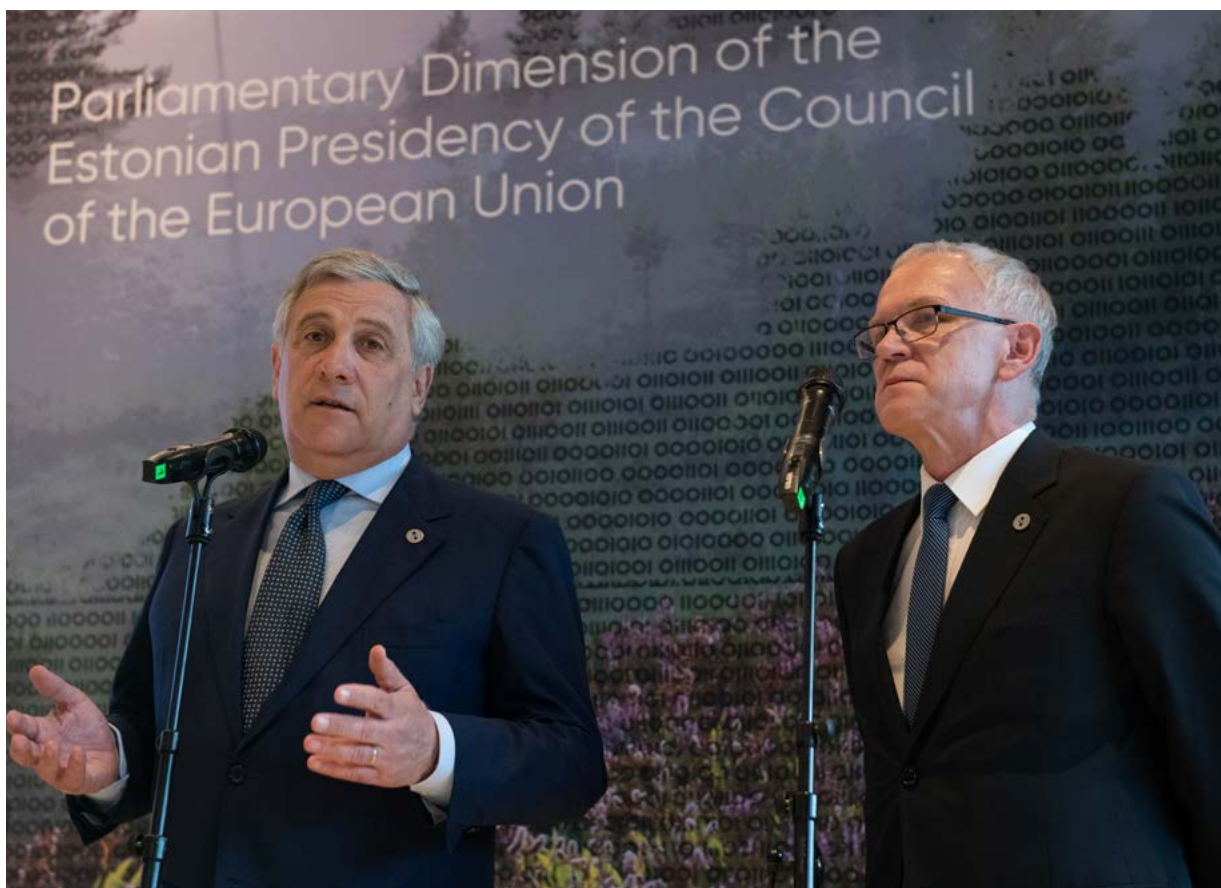
Konferencja Przewodniczących Parlamentów UE w Estonii Przewodniczący PE Antonio Tajani z przewodniczącym Riigikogu (parlamentu Estonii) Eikim Nestorem

W dorocznym posiedzeniu KPPUE, które odbyło się w Tallinie 23–24 kwietnia 2018 r. pod przewodnictwem przewodniczącego Riigikogu Eikiego Nestora, udział wzięli liczni przewodniczący parlamentów państw członkowskich UE. Po raz pierwszy w posiedzeniu KPPUE uczestniczył nowo wybrany przewodniczący Bundestagu Wolfgang Schäuble. Parlament Europejski reprezentowali przewodniczący Antonio Tajani i wiceprzewodniczący Bogusław Liberadzki.