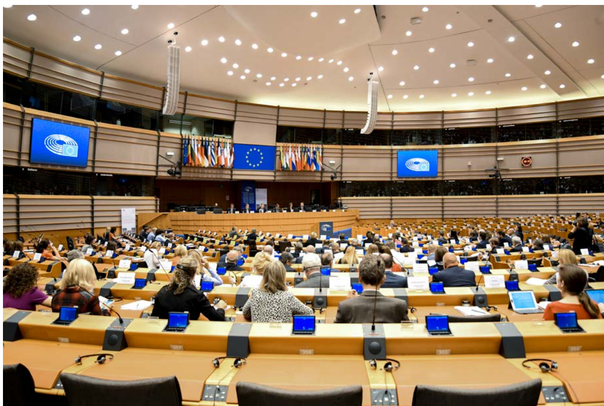
Trzecie posiedzenie grupy ds. wspólnej kontroli parlamentarnej Europolu – prezentacja priorytetów grupy przez trojkę prezydencką na lata 2018–2019

Grupa ds. wspólnej kontroli parlamentarnej odbywa dwa posiedzenia w roku: w pierwszej połowie roku w parlamencie kraju sprawującego rotacyjną prezydencję w Radzie UE oraz w drugiej połowie roku w Parlamencie Europejskim.