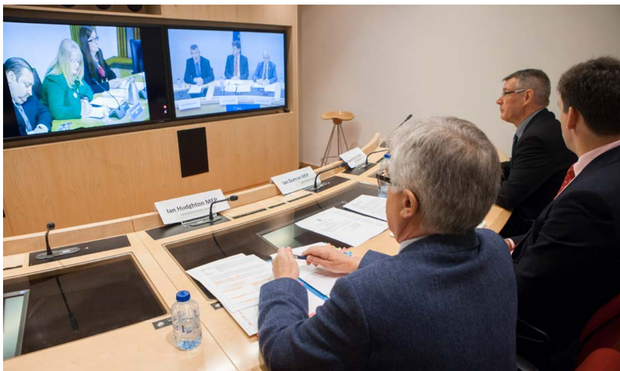
Izvajanje videokonference v Evropskem parlamentu

Izvajanje videokonferenc med nacionalnimi parlamenti EU in Evropskim parlamentom poslancem omogoča, da v daljšem času večkrat razpravljajo o določenem vprašanju ali razpravljajo o aktualnih vprašanjih, npr. o osnutku zakonodaje. Evropski parlament je nacionalnim parlamentom ponudil tudi možnost, da se prek videokonference udeležijo ene od njegovih rednih medparlamentarnih sej, in si bo za to prizadeval tudi v prihodnosti, kadar bo le mogoče.