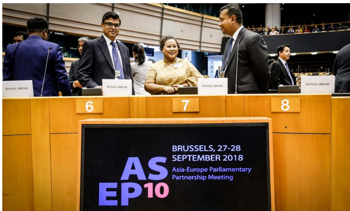
10. srečanje parlamentarnega partnerstva med Azijo in Evropo (ASEP 10) 27. septembra 2018

Parlamentarno partnerstvo med Azijo in Evropo (ASEP) je parlamentarna razsežnost političnega dialoga med Azijo in Evropo s ciljem okrepiti odnose med Evropo in Azijo. Najvidnejši element tega dialoga je azijsko-evropsko srečanje (ASEM), medvladno srečanje na vrhu, ki poteka vsaki dve leti, in sicer od leta 1996. ASEP zagotavlja parlamentarni prispevek in mreže pred tem vrhom, da bi olajšal postopke. Ker je eden od ciljev parlamentarnega partnerstva vplivati na agendo azijsko-evropskega srečanja, srečanje parlamentarnega partnerstva običajno poteka v istem kraju kot vrh, le prej. Leta 2018 je 10. srečanje ASEP (ASEP 10) potekalo 27. in 28. septembra v Bruslju. Prvič ga je gostil Evropski parlament.