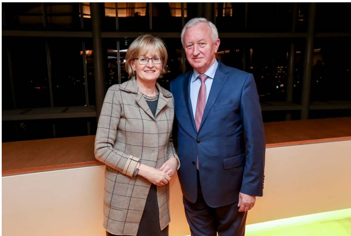
Podpredsednika Mairéad McGuinness in Bogusław Liberadzki

V skladu z Lizbonsko pogodbo je bila nacionalnim parlamentom in Evropskemu parlamentu zaupana naloga nadzora in pregleda na področju pravosodja in notranjih zadev, zlasti v zvezi z Europolom in Eurojustom. Delo skupine za skupni parlamentarni nadzor Europola, ki je bila ustanovljena leta 2017, predstavlja pomemben napredek pri medparlamentarnem sodelovanju. Glavna naloga skupine je politično spremljanje dejavnosti Europola pri izpolnjevanju nalog v času, ko je njegova vloga v boju proti terorizmu in organiziranemu kriminalu vse pomembnejša.