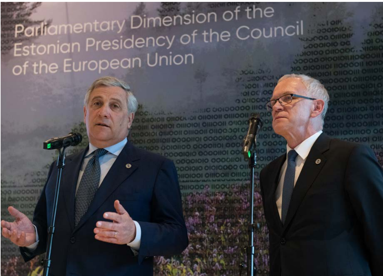
Konferenca predsednikov parlamentov EU v Estoniji. Predsednik Evropskega parlamenta Antonio Tajani se je sestel s predsednikom estonskega parlamenta Eikijem Nestorjem

Letne konference predsednikov parlamentov EU (EUSC) v Talinu 23. in 24. aprila 2018, ki ji je predsedoval predsednik estonskega parlamenta Eiki Nestor, so se udeležili številni predsedniki nacionalnih parlamentov EU. Nedavno izvoljeni predsednik nemškega zveznega parlamenta Wolfgang Schäuble se je prvič udeležil konference EUSC. Evropski parlament sta zastopala predsednik Antonio Tajani in podpredsednik Bogusław Liberadzki.