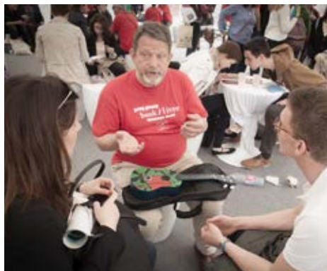
Nitkellmu dwar l-esperjenzi ta' diskriminazzjoni – il-librerija ħajja organizzata mill-Kunsill tal-Ewropa

Il-Parlament Ewropew stabbilixxa għalih innifsu l-għan li jippromwovi l-kawżi tad-drittijiet tal-bniedem madwar id-dinja, jipproteġi l-minoranzi u jippromwovi l-valuri demokratiċi