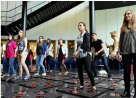
Partecipanti jesperjenzaw kif it-teknoloġija u l-eżercizzju fiziku jistgħu jingħaqdu flimkien permezz tal-magna iDance

Il-maġġoranza tal-partecipanti primarjament kienu kkonċernati dwar jekk l-aċċess għal korsijiet ta' edukazzjoni għolja jistgħux iżidu l-prospetti ta' xogħol tagħhom, u jekk tali korsijiet jistgħux jipprovdu edukazzjoni ta' kwalità. L-eżitu tad-diskussjoni ma wassalx għal twegibiet definittivi rigward dan it-tħassib, iżda n-nuqqas ta' kompetenza diġitali, in-nuqqas ta' tagħmir u l-orientazzjoni fir-rigward tal-ICT fis-sistemi edukattivi tal-istati membri ġew indikati mill-partecipanti bħala l-isfidi primarji għall-iżvilupp ta' korsijiet online miftuħa fl-Ewropa.