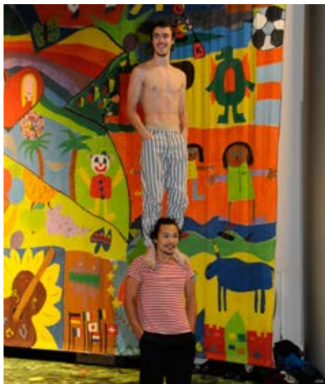
Żewġ artisti żgħażaġh waqt prestazzjoni fl-ispettaklu taċ-ċirku

- Il-problemi kollha li għandna bid-diskriminazzjoni, naħseb li nistgħu insolvuhom permezz tal-edukazzjoni; kollox idur madwar li jkollok għarfien suffiċjenti. Iridu nedukaw in-nies sabiex jifhemu x'jaqgħmel eżattament immigrant, u ma jaqgħux għall-propaganda li - l-immigrazzjoni hija biss dwar jekk aħna nagħmlux qligħ jew nitilfu l-flus - għax tinvolvi ħafna u ħafna iżjed minn dan. L-immigrazzjoni tinvolvi wkoll il-gwadann jew it-telf kulturali - prinċipalment il-gwadann.