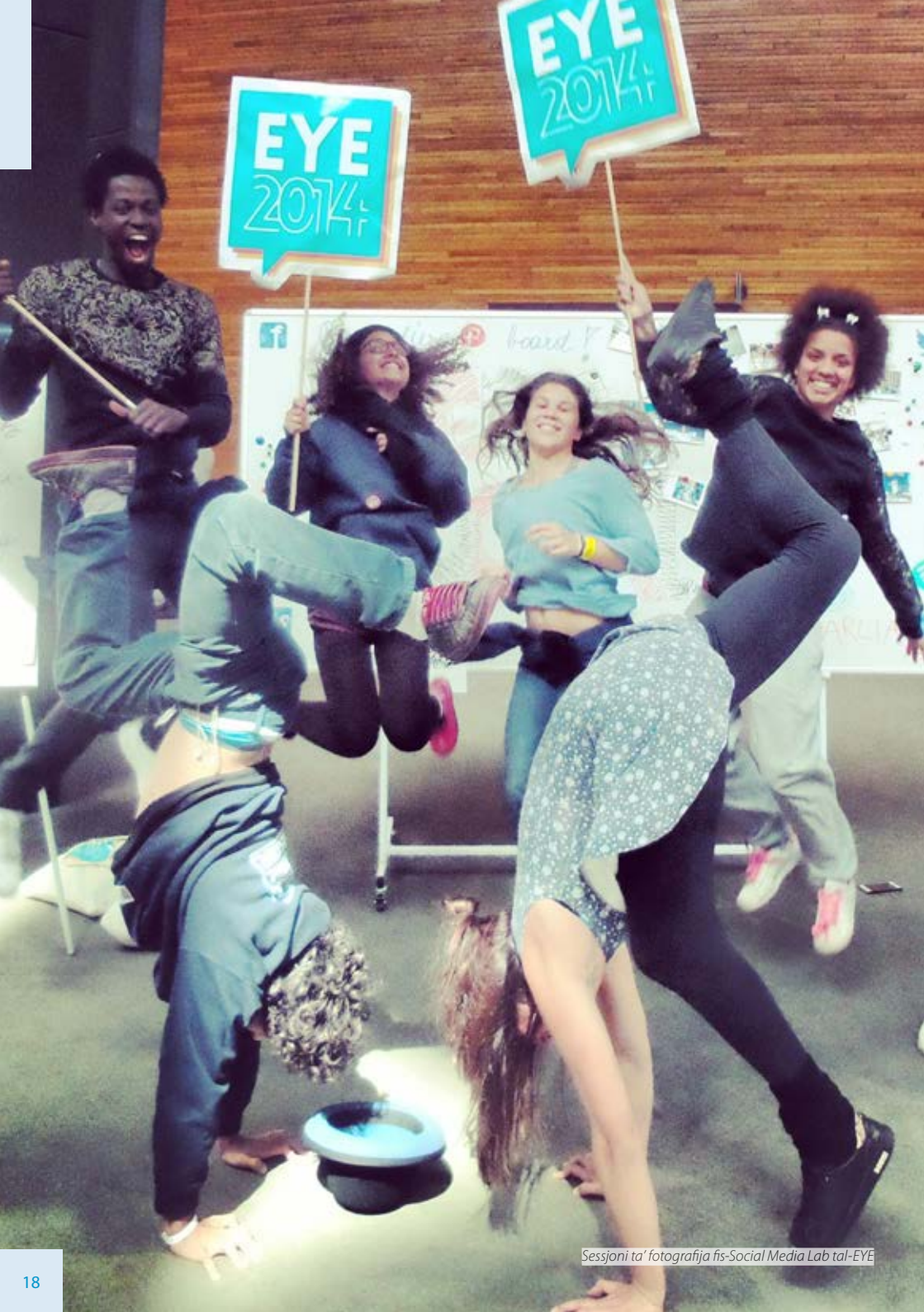
Sessjoni ta' fotografija fis-Social Media Lab tal-EYE