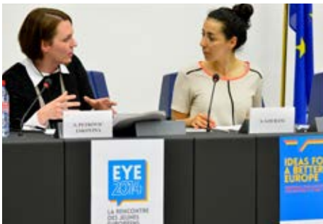
MEPs għażaġġ jiddiskutu mal-parteeipanti s-"smart cities" tal-holm tagħhom

Skont l-istudenti, ir-"rivoluzzjoni diġitali" għandha tkun definita b'rabta kemm ma' fejn ninsabu bħalissa, kif ukoll ma' x'jistgħu jkunu l-konsegwenzi tal-iżviluppi sussegwenti għall-futur. Pereżempju, xi ħadd li juża t-Twitter m'għandux jiffoka fuq il-veloċità li biha jivvjaġġaw il-messaġġi tiegħu madwar il-komunità globalizzata tagħna; iżda, għandu jiffoka fuq l-użu tat-Twitter għal diskussjonijiet politiċi, u kif dan se jbidel il-kunċetti tagħna ta' "dibattitu" fil-futur. Il-ġenerazzjoni li jmiss mhux se tassocja dibattitu ma' konverżazzjoni ta' tliet sigħat. Allura għandna nżommu lill-innovaturi responsabbli għall-użu "tajjeb" jew "ħażin" tal-applikazzjonijiet tagħhom? It-teknoloġiji tagħhom ma jiġux bl-istruzzjonijiet għall-użu, u hekk għandu jkun; il-protezzjoni tal-libertà ta' espressjoni hija kruċjali għal soċjetà demokratika.