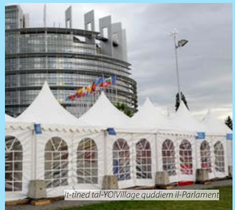
It-tined ta' YO! Village quddiem il-Parlament

Huwa fundamentali li tiġi assicurata parteċipazzjoni taż-żgħażaġh ta' kwalità bil-ħsieb li titrawwem kultura ta' ċittadinanza responsabli, proattiva u demokratika. Iż-żgħażaġh iridu jingħataw is-setgħa u jiġu inkluzi fit-teħid ta' deċiżjonijiet soċjali, politiċi u ekonomiċi. Dan ifisser ukoll il-parteeipazzjoni sinifikanti tagħhom fil-formulazzjoni u l-implimentazzjoni ta' politiki u azzjonijiet relatati mal-iżvilupp. L-organizzazzjonijiet taż-żgħażaġh huma s-šhab essenzjali fil-iżvilupp ta' proċessi sostenibbli ta' parteċipazzjoni taż-żgħażaġh. Dawn iridu jiġu rikonnoxxuti għar-rwol tagħhom fl-għoti tas-setgħa liż-żgħażaġh permezz ta' edukazzjoni mhux formali, u għandhom jitqiesu bħala šhab kostanti fil-proċessi tat-teħid tad-deċiżjonijiet.