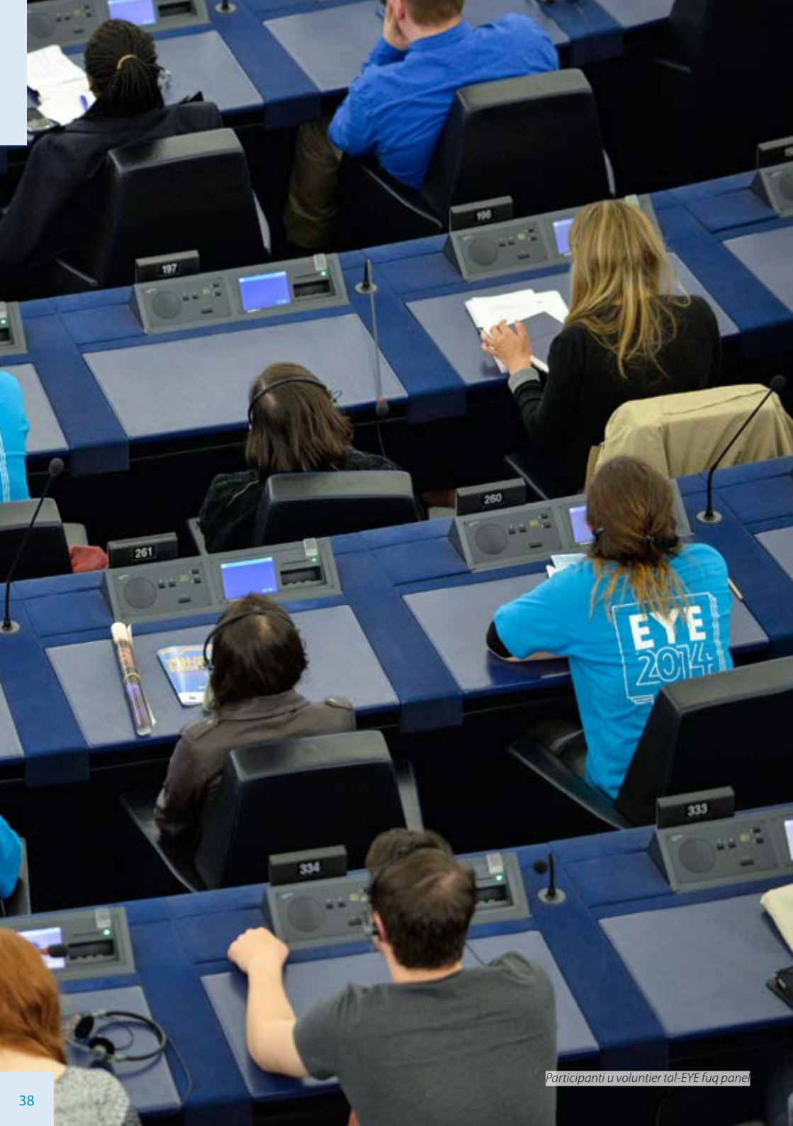
Participanti u voluntier tal-EYE fuq panej