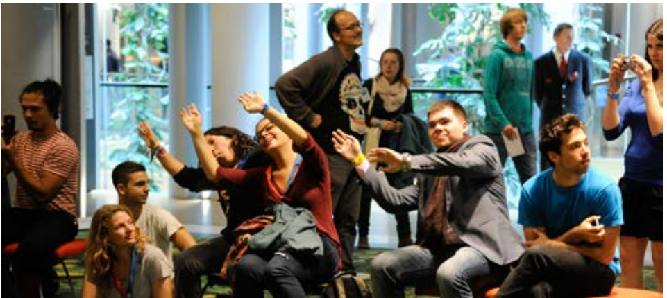
Parteċipanti isegwu b'interess l-ispettaklu fil-bar tal-furi

– Hadd ma jaf x'inhi l-Ewropa - hija taħwida, imma sabiħa!