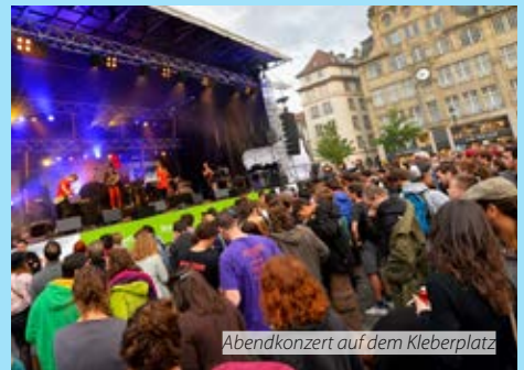
Abendkonzert auf dem Kleberplatz

Il-Forum taż-żgħażaġh u l-membri tiegħu, organizzazzjonijiet taż-żgħażaġh mill-Ewropa kollha, mhumiex l-uniċi li jemmnu dan. 240 kandidat mill-Parlament Ewropew u 85 Membru tal-PE eletti minn fost il-gruppi politiċi u l-pajjiżi wrew li jaqblu ma' bosta minn dawn l-ideat permezz tal-kampanja LoveYouthFuture.