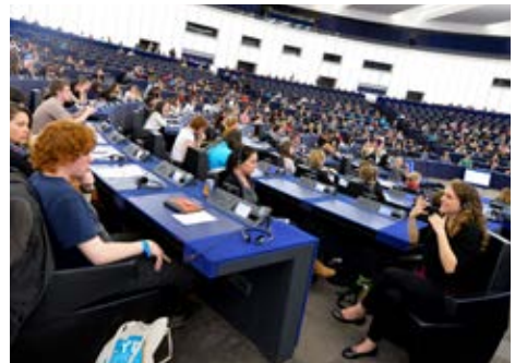
Interpretazzjoni bis-sinjali fl-EYE 2014

Permezz tal-kunċerti pubbliċi tal-YO!Fest fil-belt ta' Strasburg u ta' Wacken, l-EYE laħaq ferm aktar minn 5 500 partecipant, filwaqt li attira 4 500 persuna lejn il-Parlament Ewropew u l-Forum taż-Żgħażaġh. Il-kunċerti offrew attrazzjoni biex jintlaħqu n-nies lokali fi Strasburg kif ukoll iż-żgħażaġh l-anqas impenjati, u biex ikunu motivati għadd ta' persuni jippartecipaw f'attivitajiet oħra tal-YO!Fest. Bl-istess mod, l-attivitajiet u l-ispettakli relatati tal-EYE li saru fil-belt ta' Strasburg,