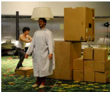
Mument ieħor mill-ispettaklu taċ-ċirku fil-bar tal-fjuri

F'dibattitu bejn esperti dwar il-futur tas-sajd sostenibbli, il-partecipanti ħadu nota tal-kisbiet reċenti tal-UE fir-rigward tal-modifiki legiżlattivi, iżda anki tal-isfidi l-kbar involuti għall-implimentazzjoni u l-kisb ta' strateġija komuni tal-UE, minkejja l-fatt li ċerti pajjiżi jintlaqtu aktar minn oħrajn. Il-partecipanti kkritikaw l-attività qawwija ta' lobbying li dan l-aħħar wasslet għar-rifjut, minn maġġoranza modesta fi ħdan il-Parlament, tal-eliminazzjoni gradwali tas-sajd bit-tkarkir tal-qiegħ distruttiv fil-baħar fond, barra minn hekk inħass il-bżonn li l-kwistjoni titpoġġa mill-ġdid fl-aġenda. Bosta partecipanti, partikolarment tal-Ewropa tan-Nofsinhar, appellaw ukoll għal aktar inċentivi u sostenn favur is-sajjeda ta' pajjiżhom, sabiex ikunu jistgħu, ngħidu aħna, jaqalghu l-għajxien tagħhom bl-attività tat-turiżmu tas-sajd. Skonthom il-kwoti u r-regolamentazzjoni eċċessiva tal-UE jinfluwenzaw negattivament il-komunitajiet tagħhom. Kemm l-esperti kif ukoll il-partecipanti ssuġġerew flessibbiltà akbar fir-rigward tal-kwoti biex jitnaqqsu l-kwantitajiet ta' ħut li