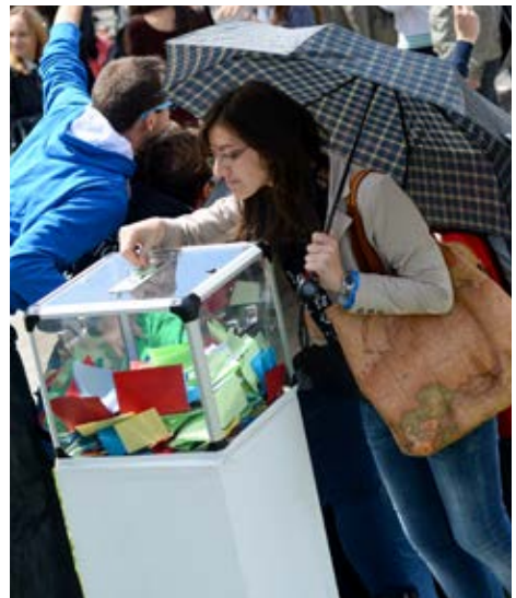
Il-kaxxa tal-ideat timtela bi proposti għal Ewropa aħjar

Kmieni wara nofsinhar, hekk kif il-partecipanti bdew triqithom lejn id-dar, kienu għadhom jbernu bosta mistoqsijiet: Għalfejn numru daqstant kbir ta' Membri tal-Parlament ikkanċellaw l-attendanza tagħhom fil-panels? Fejn kien il-President tal-Parlament Ewropew Martin Schulz? Fejn kienet id-diversità tal-Unjoni Ewropea - kuncett li kien jirrigwarda bosta mill-attivitatiet, iżda li mhux dejjem kien rifless mill-kelliema? Wara tliet ijiem ta' diskusjonijiet imqanqla, kien jidher ċar li l-partecipanti żgħażaġh xtaqu jinvolvu rwieħhom fil-politika Ewropea, u filwaqt li l-kwazi 5 500 partecipant ipproponew ħafna ideat tajbin għal Ewropa aħjar matul dan l-avveniment, issa jmiss lill-Membri eletti tal-Parlament li jieħdu azzjoni fuqhom.