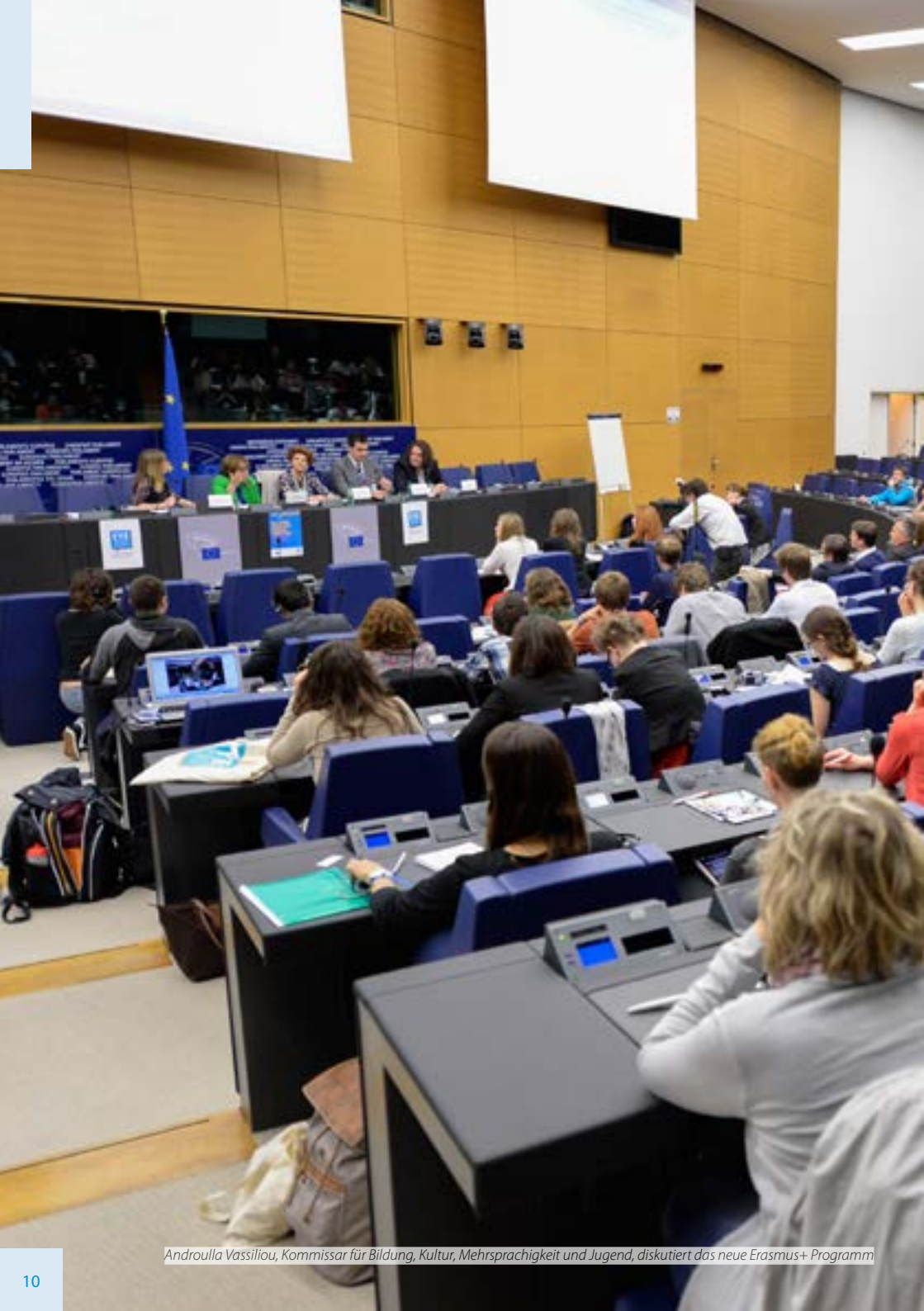
Androulla Vassiliou, Kommissar für Bildung, Kultur, Mehrsprachigkeit und Jugend, diskutiert das neue Erasmus+ Programm