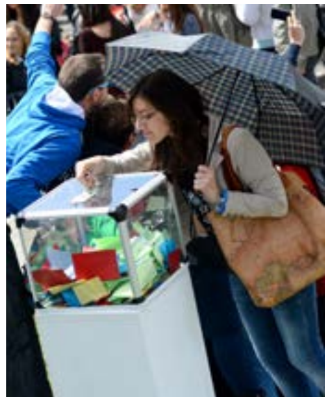
Die Ideenbox wird mit Vorschlägen für ein besseres Europa gefüllt

Am frühen Nachmittag, als die ersten Teilnehmer aufbrachen, blieben noch viele Fragen offen: Warum sagten so viele Mitglieder des Parlaments ihre Teilnahme an den Podiumsdiskussionen ab? Wo war der Präsident des Europäischen Parlaments, Martin Schulz? Wo blieb die Vielfalt der Europäischen Union, ein Konzept, das bei so vielen der Aktivitäten aufgenommen, von den Rednern aber nicht immer aufgegriffen wurde? Nach drei Tagen leidenschaftlich geführter Diskussionen wurde deutlich, dass die jungen Teilnehmer an der Gestaltung der europäischen Politik mitwirken wollen, und die vielen guten Ideen für ein besseres Europa, die im Laufe des Events von den annähernd 5 500 Teilnehmern aufgebracht wurden, müssen jetzt von den gewählten Mitgliedern des Europäischen Parlaments in die Tat umgesetzt werden.