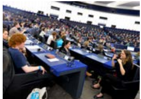
Übersetzung von Gebärdensprache während dem EYE 2014

Mit den öffentlichen Konzerten, die im Rahmen von YO!Fest in Straßburg und Wacken stattfanden, konnte EYE mehr als 5 500 Teilnehmer gewinnen, sodass noch zusätzlich 4 500 Menschen zum Europäischen Parlament und zum Jugendforum kamen. Durch die Konzerte sollten auch Einwohner von Straßburg und weniger aktive Jugendliche angelockt und für die Teilnahme