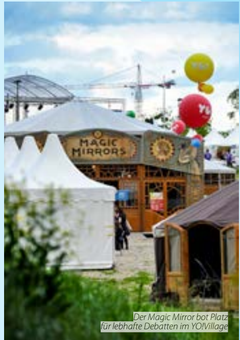
Der Magic Mirror bot Platz für lebhaftes Debatten im YO!Village

Nicht nachhaltigem Konsumverhalten und nicht nachhaltigen Produktionsstrukturen muss unbedingt entgegengetreten werden. Die EU steht aufgrund ihrer Verantwortung für einen unangemessen hohen Anteil am weltweiten Konsum besonders in der Pflicht, Maßnahmen zu ergreifen. Die Verbraucher müssen umfassend informiert und angeleitet werden. Die Bürger müssen verstärkt für ihre Verantwortung und für die Folgen eines übermäßigen Energie- und Ressourcenverbrauchs sensibilisiert werden. Gleichzeitig müssen vorrangig Alternativen gefördert werden, die eine erhöhte Effizienz und eine ausgewogenere Verteilung des Konsums