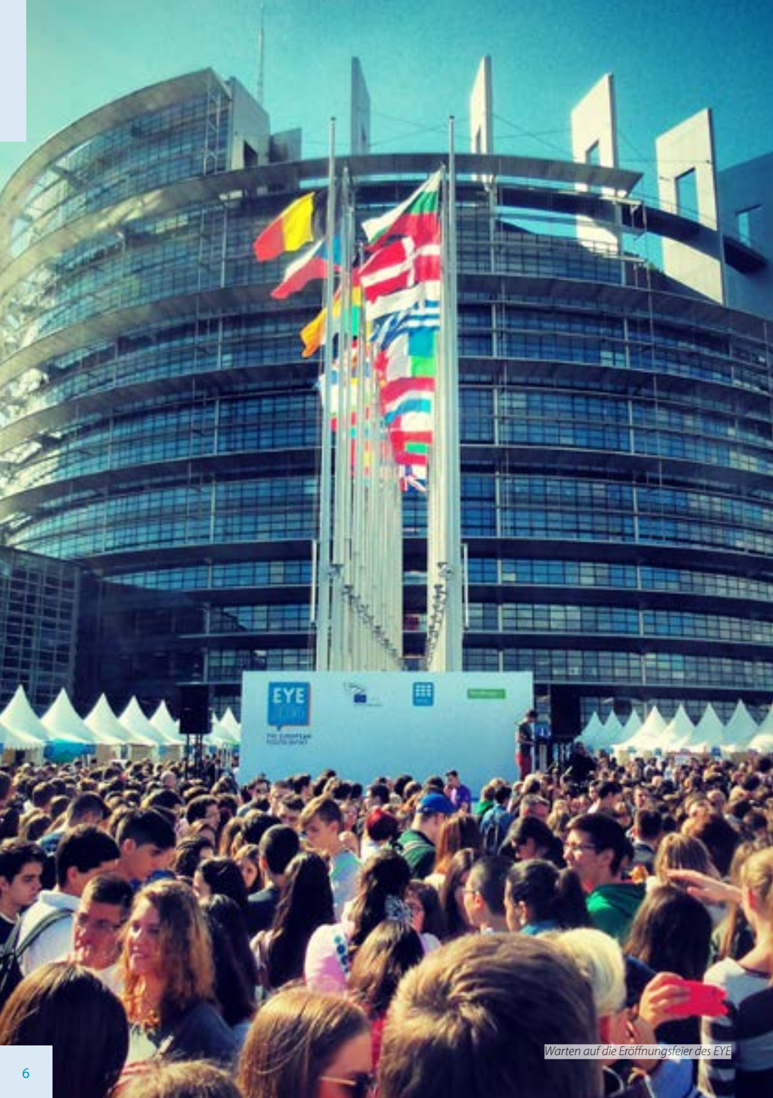
Warten auf die Eröffnungsfeier des EYE