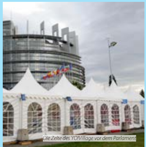
Die Zelte des YOIVillage vor dem Parlament

Die umfassende Teilhabe junger Menschen ist von grundlegender Bedeutung für die Förderung eines verantwortungsvollen, proaktiven und demokratischen Bürgersinns. Junge Menschen müssen gefördert und in die soziale, politische und wirtschaftliche Beschlussfassung einbezogen werden, wozu auch ihre umfassende Beteiligung an der Ausarbeitung und Umsetzung entwicklungsbezogener Strategien und Maßnahmen gehört. Jugendorganisationen sind ein wichtiger Partner bei der Gestaltung nachhaltiger Prozesse für die Beteiligung junger Menschen. Sie müssen für Ihre Funktion bei der Förderung junger Menschen im Rahmen nicht-formaler Bildung Anerkennung