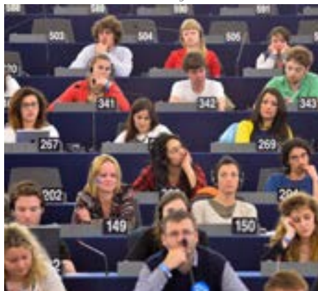
Junge Teilnehmer nehmen die Plätze der Abgeordneten im Plenarsaal ein