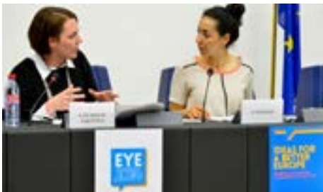
Junge Abgeordnete diskutieren mit Teilnehmern die „Smart Cities“ ihrer Träume

Nach Auffassung der Studenten sollte der Begriff „digitale Revolution“ anhand sowohl des derzeitigen Entwicklungsstands als auch der Folgen definiert werden, die künftige Entwicklungen in Zukunft mit sich bringen könnten. Ein Twitter-Nutzer sollte sich also beispielsweise nicht nur dafür interessieren, wie schnell seine Nachrichten sich in der globalen Gemeinschaft verbreiten lassen, sondern auch in Betracht ziehen, wie Twitter für politische Debatten genutzt werden kann und wie sich unser Verständnis von „Debatte“ dadurch in Zukunft ändern wird. Die nächste Generation wird mit dem Begriff „Debatte“ kein dreistündiges Gespräch mehr verbinden. Sollten wir also die Innovatoren für die „richtige“ oder „falsche“ Nutzung ihrer Anwendungen verantwortlich machen? Ihre Technologien werden nicht zusammen mit einem Handbuch angeboten, und das ist richtig so, denn für eine demokratische Gesellschaft ist und bleibt der Schutz der Meinungsfreiheit ausschlaggebend.