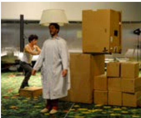
Ein weiterer Einblick in die Zirkusshow in der Flower Bar

„Wer wird sich für die Umwelt einsetzen, wenn nicht die Europäische Union? Die jüngste Abschwächung des Vorschlags für die Kraftstoffqualitätsrichtlinie muss abgelehnt werden, denn sie ermöglicht die Einfuhr von Ölsand in die EU.“