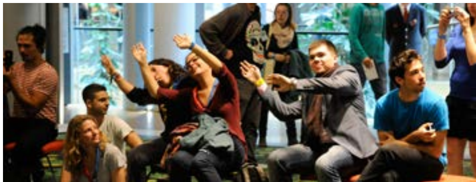
Teilnehmer verfolgen und bejubeln eine Show in der Flower Bar