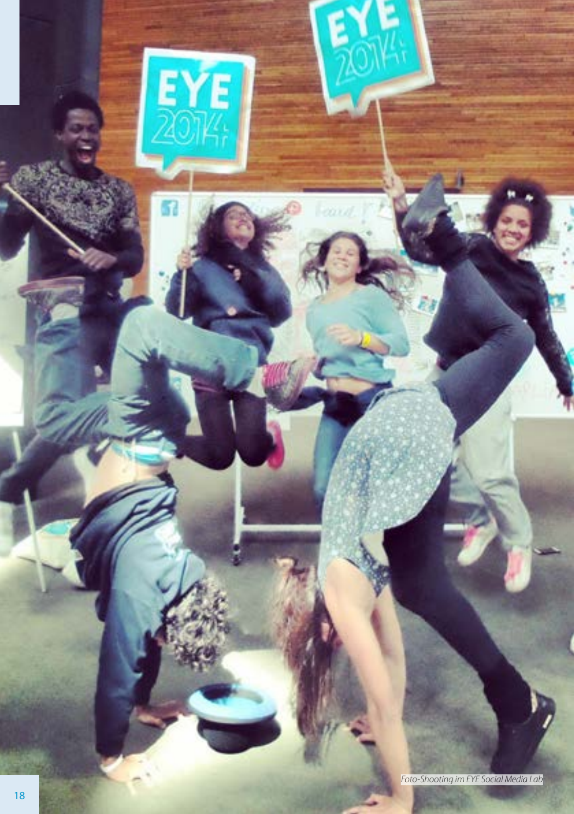
Foto-Shooting im EYE Social Media Lab