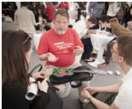
Über Diskriminierungserfahrungen sprechen - Die vom Europarat organisierte "Living Library"

Das Europäische Parlament hat sich selbst das Ziel gesetzt, menschenrechtliche Anliegen weltweit zu fördern, Minderheiten zu schützen und sich für demokratische Werte (nicht zuletzt die Informations- und Pressefreiheit)