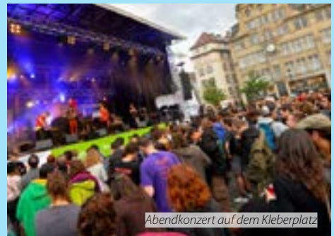
Abendkonzert auf dem Kleberplatz

Nicht nur das Jugendforum und seine Mitglieder – Jugendorganisationen aus ganz Europa – vertreten diese Ideen. 240 Kandidaten für das Europäische Parlament und 85 gewählte MdEP aus allen Fraktionen und Ländern schlossen sich im Rahmen der LoveYouthFuture-Kampagne vielen dieser Forderungen an.