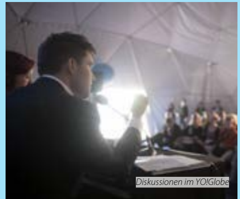
Diskussionen im YO!Globe

Digital Agenda Scoreboard 2013: https://ec.europa.eu/digital-agenda/sites/digital-agenda/files/DAEA%20SCOREBOARD%202013%20-%20%20SWD%202013%2020217%20FINAL.pdf