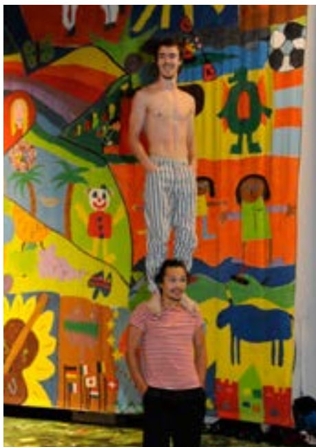
Zwei junge Artisten treten in der Zirkusshow auf

„Alle Probleme, die aufgrund von Diskriminierung bestehen, können meines Erachtens mit entsprechenden Bildungsangeboten gelöst werden, denn im Kern sind die Probleme auf