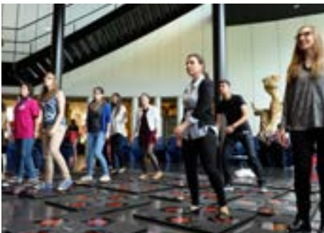
Teilnehmer erfahren wie Technologie und Fitness durch die iDance Machine miteinhergehen können

Die Cyberkriminalität hat zweifellos zu gesetzlichen Änderungen geführt, und zwar nicht nur auf der Ebene der Nationalstaaten,