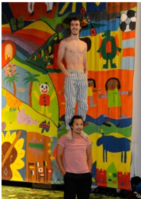
Twee jonge artiesten tijdens de circus voorstelling

– Ik ben van mening dat we alle problemen met discriminatie kunnen oplossen door de mensen te scholen: het is allemaal te wijten aan een gebrek aan kennis. We moeten de mensen zo