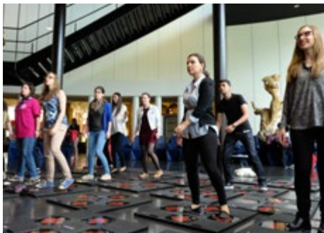
Deelnemers ervaren hoe technologie en fitness samengaan met het iDance toestel

Cybercriminaliteit heeft de wet zonder meer veranderd, niet alleen op nationaal maar ook op