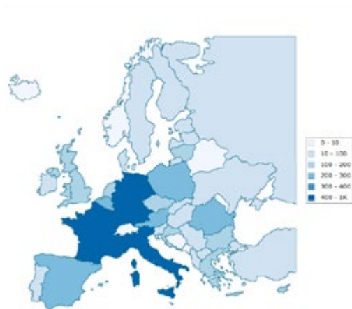
Nationaliteiten van de deelnemers