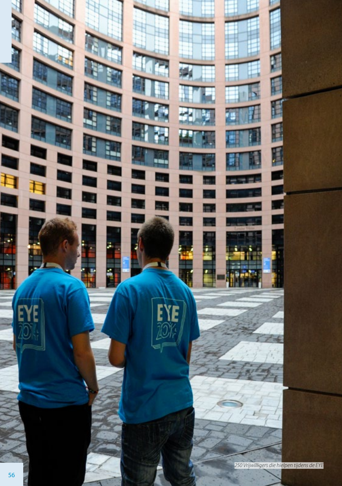
250 Vrijwilligers die hielpen tijdens de EYE