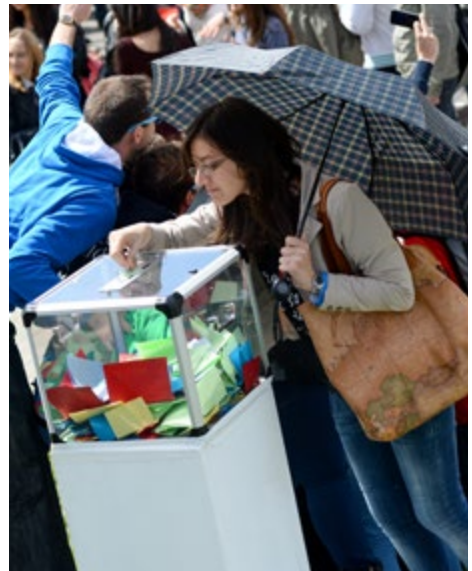
De ideeënbus met voorstellen voor een beter Europa

In het begin van de middag, toen de deelnemers zich opmaakten om naar huis te gaan, bleven nog veel vragen onbeantwoord: Waarom hebben zo veel parlementsleden hun deelname aan de panels afgezegd? Waar was de voorzitter van het Europees Parlement, Martin Schulz? Waar was de verscheidenheid van de Europese Unie – een concept waar zo veel activiteiten naar verwezen, maar niet altijd werd weerspiegeld in de keuze van de sprekers? Na drie dagen hartstochtelijke discussie was het duidelijk geworden dat de jonge deelnemers zich in de Europese politiek willen mengen, en met zo veel goede ideeën voor een beter Europa, die door de bijna 5 500 deelnemers in de loop van het evenement waren geopperd, is het nu aan de verkozen leden van het Europees Parlement om op basis van deze ideeën tot actie over te gaan.