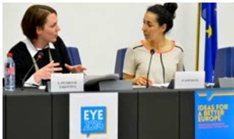
Jonge Europarlementsleden debatteren met jonge deelnemer over de "smart cities" (slimme steden) van hun dromen

Volgens de studenten moet "digitale revolutie" worden gedefinieerd in verband met de huidige stand van zaken en de eventuele implicaties voor de toekomst van volgende ontwikkelingen. Twittergebruikers moeten zich bijvoorbeeld niet concentreren op de snelheid waarmee berichten door onze geglobaliseerde gemeenschap kunnen worden gestuurd; ze kunnen zich beter bezighouden met het gebruik van Twitter voor politieke discussies en hoe dit onze opvatting van het begrip "debat" in de toekomst zal veranderen. De volgende generatie zal een debat niet associëren met een gesprek van drie uur. Moeten we dan innoverende personen verantwoordelijk stellen voor het "juiste" of "verkeerde" gebruik van hun programma's? Hun technologie wordt niet geleverd met een handleiding, en terecht; de bescherming van vrijheid van meningsuiting blijft cruciaal voor een democratische samenleving.