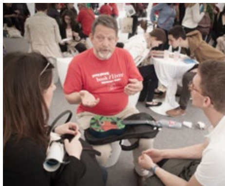
Gesprek over discriminatie, georganiseerd door de "Living Library" werkgroep van de Raad van Europa

Het Europees Parlement heeft zich ten doel gesteld het respect voor mensenrechten wereldwijd te bevorderen, minderheden te beschermen, en democratische waarden te promoten (niet in het minst de informatie- en persvrijheid). Op het vlak van de digitale media revolutie verandert de situatie momenteel zeer snel; nieuwe methoden worden ontwikkeld om