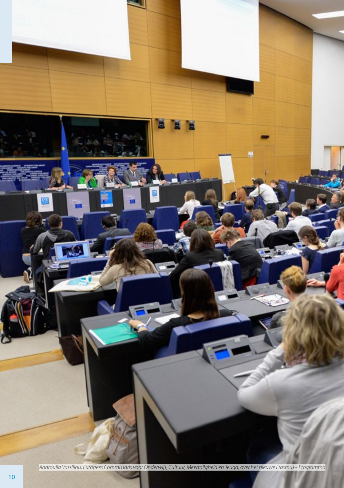
Androulla Vassiliou, Europees Commissaris voor Onderwijs, Cultuur, Meertaligheid en Jeugd, over het nieuwe Erasmus+ Programma