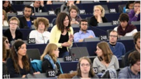
Deelnemers nemen het woord

wees uit dat dergelijke camera's weinig invloed hebben op het aantal misdrijven.