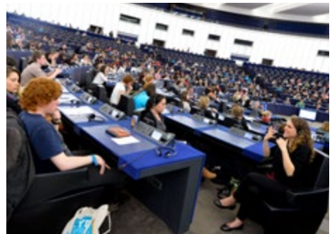
Gebarentaal tolk tijdens het EYE

Op de voor iedereen toegankelijke concerten "YO!Fest" in Straatsburg en Wacken waren er veel meer dan 5500 personen aanwezig, zodat er 4500 mensen extra deelnamen aan de activiteiten rondom het Europees Parlement en het Jeugdforum. De concerten fungeerden als publiekstrekker om de bewoners van Straatsburg en minder betrokken jongeren te bereiken, en stimuleerden een groot aantal mensen om deel te nemen aan andere YO!Fest-activiteiten.