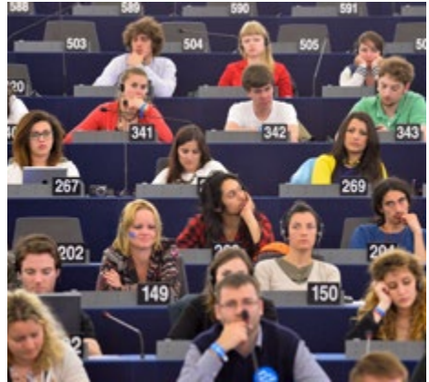
Jonge deelnemers op de plaats van Europarlementsleden in de plenaire zaal