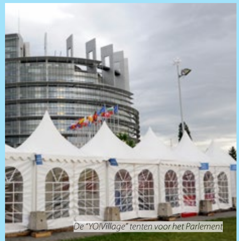
De "YOIVillage" tenten voor het Parlement

Hoogstaande jongerenparticipatie is vitaal om een cultuur te bevorderen van verantwoordelijk, proactief en democratisch burgerschap. Jongeren moeten het recht hebben deel te nemen aan en betrokken te worden in maatschappelijke, politieke en economische besluitvorming, met inbegrip van zinvolle participatie in de formulering en uitvoering van beleid en maatregelen op het gebied van ontwikkeling. Jongerenorganisaties zijn een cruciale partner in de ontwikkeling van duurzame jongerenparticipatie. Zij moeten erkend worden voor hun rol in de emancipatie van jongeren door informele educatie en een vaste partner zijn in besluitvormingsprocessen.