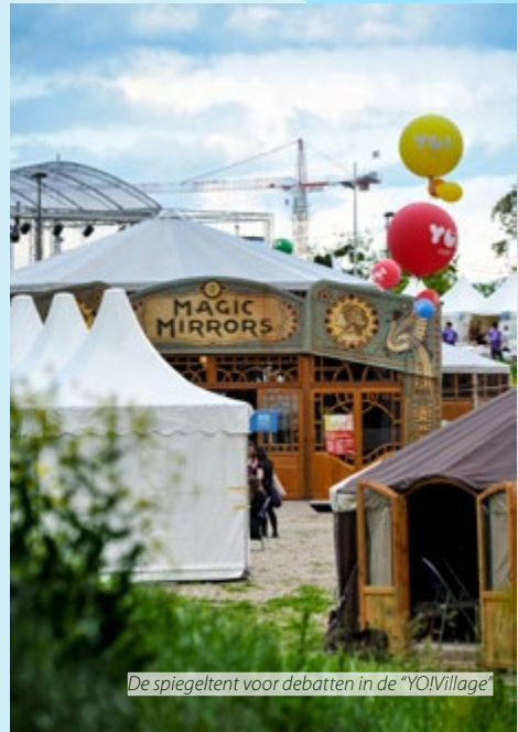
De spiegelt voor debatten in de "YO!Village"

Niet-duurzame consumptie- en productiepatronen moeten dringend worden aangepakt. De EU heeft een bijzondere plicht om maatregelen te treffen vanwege haar onevenredig grote aandeel in de mondiale consumptie heeft. Consumenteneducatie is dringend nodig. De burgers moet zich beter bewust zijn van hun verantwoordelijkheden en van de gevolgen van overconsumptie van energie en hulpbronnen. Tegelijkertijd moet de bevordering van alternatieven die zorgen voor een grotere efficiëntie en een meer rechtvaardige verdeling van de consumptie, prioriteit hebben. Jongerenorganisaties zijn in dit verband een belangrijke partner vanwege hun informele onderwijs dat een bewezen en effectief middel is voor maatschappelijke verandering.