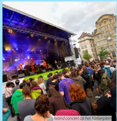
Avond concert op het Kleberplein

Het Europees Jeugdforum en zijn leden, jongerenorganisaties in heel Europa, staan hierin niet alleen. 240 kandidaten voor het Europees Parlement en 85 verkozen leden verdeeld over alle fracties en landen, hebben veel van deze ideeën onderschreven in het kader van de campagne LoveYouthFuture.