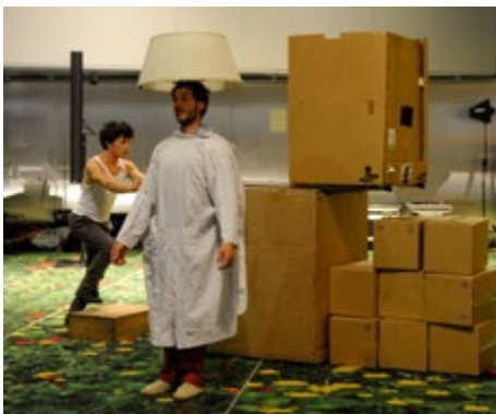
Een andere circus voorstelling

Tijdens een paneldiscussie over de toekomst van duurzame visserij stelden de deelnemers vast dat de EU resultaten had geboekt met de verandering van de regelgeving, maar constateerden ook de grote problemen bij de tenuitvoerlegging daarvan en bij de totstandkoming van een gemeenschappelijk EU-beleid, ondanks het feit dat sommige landen daarvan de gevolgen veel meer moeten dragen dan anderen. De deelnemers hadden kritiek op de sterke lobby die er onlangs toe geleid heeft dat een kleine meerderheid in het Parlement het afbouwen van schadelijke diepzeevisserij met bodemtrawlers heeft afgewezen, en waren van mening dat de kwestie opnieuw op de agenda zou moeten worden gezet. Voorts vroegen veel deelnemers, met name die uit Zuid-Europese landen, om meer stimulansen en steun aan vissers in hun landen, zodat deze bijvoorbeeld hun brood kunnen gaan verdienen met visserijtoerisme. Ze vonden dat de quota's en buitensporige EU-regelgeving een negatief effect hebben op hun gemeenschappen. Panelleden en deelnemers stelden een groter soepelheid voor wat betreft de quota's, zodat minder vis wordt teruggegooid in zee, en stimulansen voor