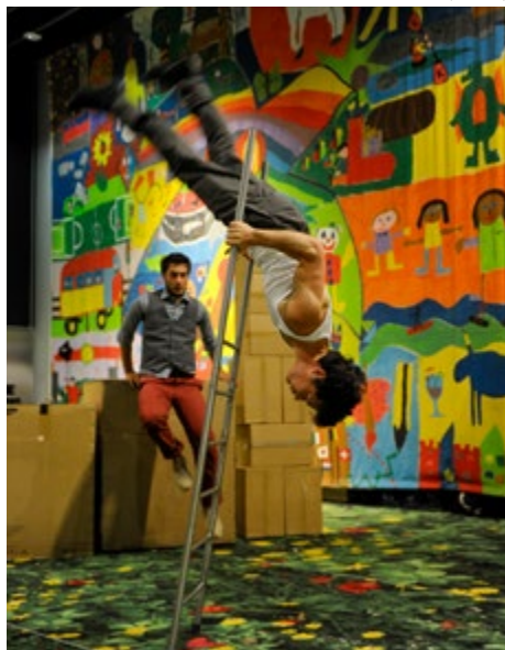
Circusvoorstelling door de Europese Federatie van Professionele Circusscholen (FEDEC)

onder jongeren te voorkomen, moet het probleem beter doorgrond worden.