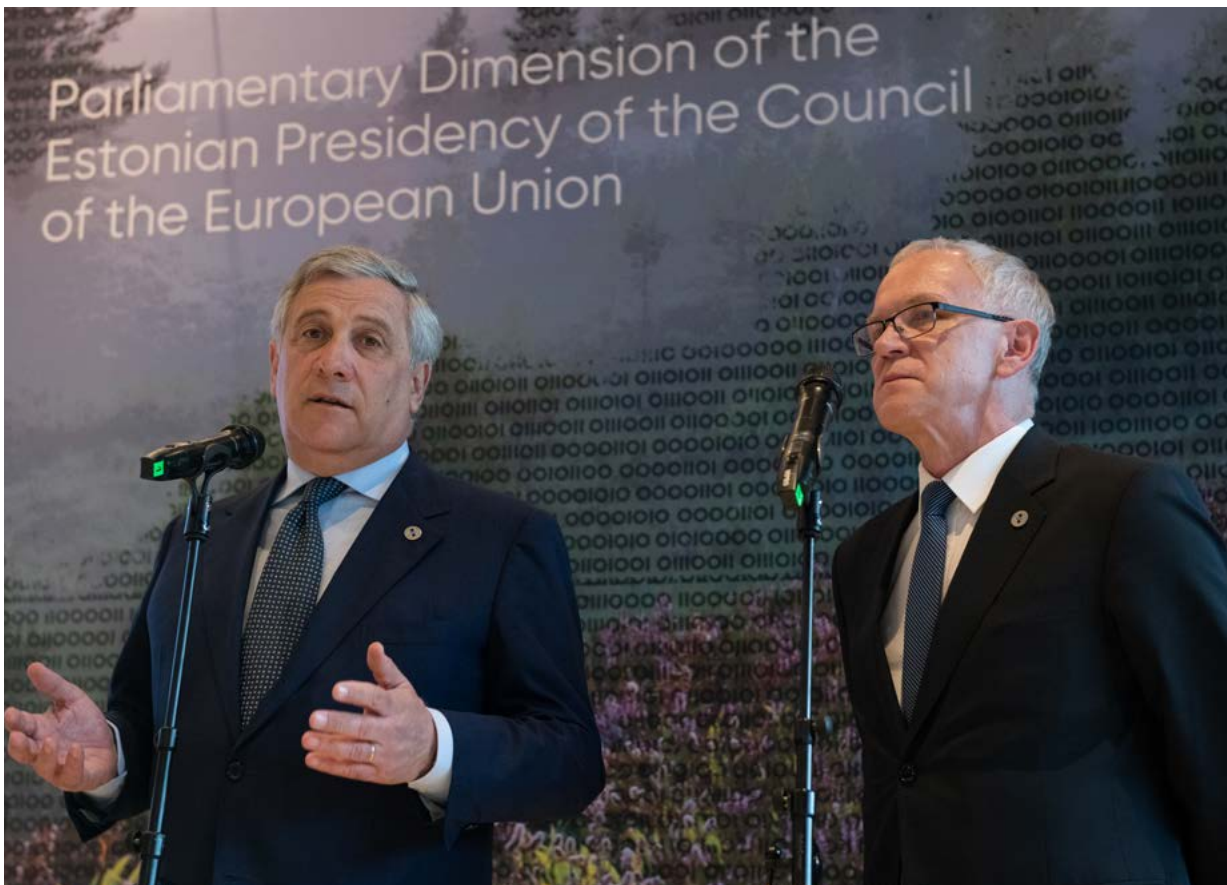
Konferensen för talmän i EU-ländernas parlament, i Estland. Europaparlamentets talman, Antonio Tajani, träffar Eiki Nestor, talman i det estniska parlamentet (Riigikogu)

Den årliga konferensen för talmän i EU-ländernas parlament, som 2018 hölls i Tallinn den 23-24 april under ledning av Eiki Nestor, talman i det estniska parlamentet (Riigikogu), präglades av god uppslutning i form av talmän från de nationella parlamenten i EU. Den tyska förbundsdagens nya talman, Wolfgang Schäuble, gjorde sitt första framträdande inför konferensen för talmän i EU-ländernas parlament. Europaparlamentet företrädades av talman Antonio Tajani och vice talman Bogusław Liberadzki.