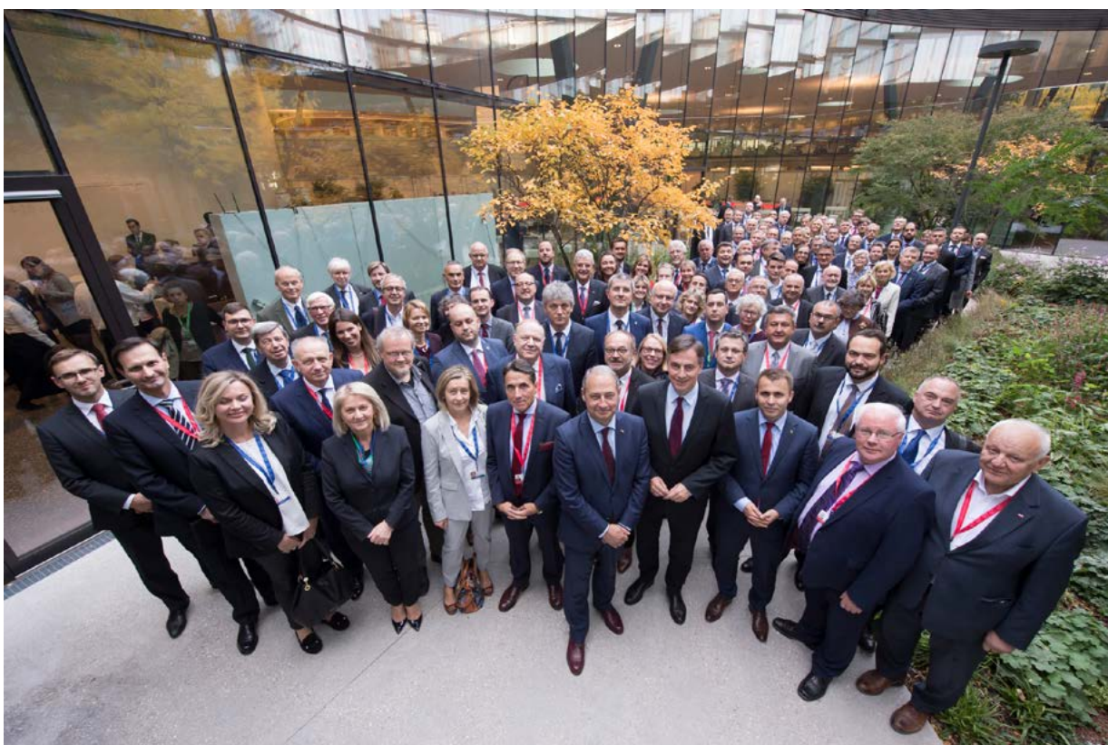
Den interparlamentariska konferensen för den gemensamma utrikes- och säkerhetspolitiken och den gemensamma säkerhets- och försvarspolitiken (Gusp/GSFP) i Wien den 11–12 oktober 2018

Under 2018 gick den tolfte och trettande upplagan av den interparlamentariska konferensen för Gusp/GSFP av stapeln i Sofia (den 15–17 februari) och i Wien (den 11–12 oktober). Europaparlamentets delegationer till båda mötena bestod av ledamöter från utskottet för utrikesfrågor och underutskottet för säkerhet och försvar. Deras ordförande var David McAllister, ordförande för utskottet för utrikesfrågor.