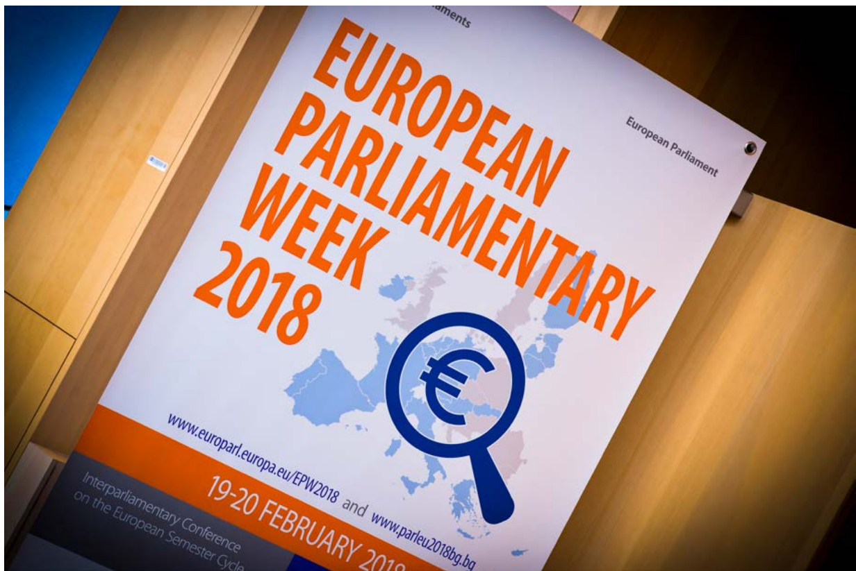
Europeiska parlamentsveckan ägde rum den 19–20 februari 2018 i Bryssel

Som en av de två årliga interparlamentariska konferenserna stod det österrikiska parlamentet – inom ramen för det österrikiska EU-ordförandeskapet – värd för den andra interparlamentariska konferensen om stabilitet, ekonomisk samordning och styrning i Europeiska unionen den 17–18 september 2018 i Wien. Denna interparlamentariska konferens var främst inriktad på diskussioner inom följande fyra områden: