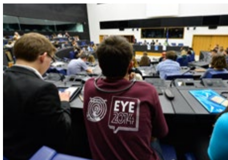
Fiatal EYMD újságíró figyeli a vitát

legjobb lenne, ha ezek a készségek az egyetemi tantervekbe is beépülnének.”