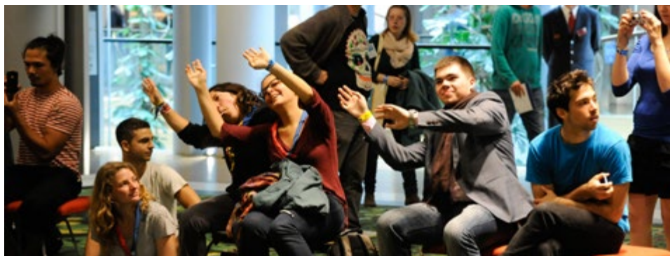
Résztvevők élvezik a büfében tartott előadást

„Senki sem tudja megmondani, mi is Európa. Kicsit összevissza, de mégis klassz!”