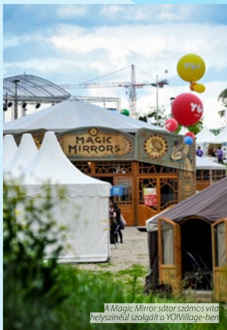
A Magic Mirror sátor számos vita helyszínénél szolgált a YO!Village-ben

Sürgősen kezelni kell a fenntarthatatlan fogyasztási és termelési szokások problémáját. Az Uniót már csak azért is különös felelősség terheli, mert a világszintű fogyasztás aránytalanul nagy része itt zajlik. Sürgősen el kell kezdeni formálni a fogyasztói szokásokat. Az európaiaknak jobban tisztában kell lenniük a rájuk háruló felelősséggel és a túlzott energia- és erőforrás-felhasználás következményeivel. Ezzel párhuzamosan elsőbbséget kell élvezniük azon alternatív megoldásoknak, amelyek