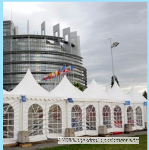
A YOYVillage sátrai a parlament előtt

A fiatalok hathatós részvétele alapvetően fontos a felelős, kezdeményező és demokratikus polgárság kultúrájának kialakításában. Biztosítani kell a fiatalok szerepvállalását és be kell őket vonni a társadalmi, politikai és gazdasági döntéshozatalba, beleértve a fejlesztéshez kapcsolódó szakpolitikák kidolgozásában és végrehajtásában való érdemi részvételt is. Az ifjúsági szervezeteknek partnerként kell közreműködniük a fiatalok bevonását célzó módszerek kialakításában. El kell ismerni azon szerepüket, amelyet az általuk biztosított nem formális oktatás révén a fiatalok társadalmi részvételének fokozásában játszanak, és a