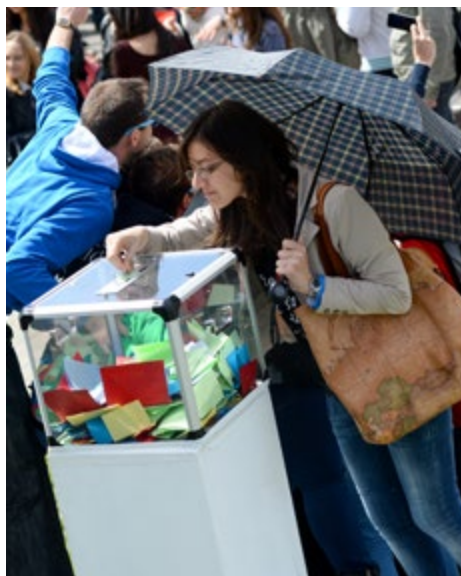
Érkeznek a jobb Európát célzó ötletek az ötletdobozba

Amikor a résztvevők kora délután hazaindultak, még számos kérdés megválaszolatlan maradt. Miért mondta le annyi európai parlamenti képviselő a vitafórumokon való részvételét? Hol volt az Európai Parlament elnöke, Martin Schulz? Hova tűnt az Európai Unió sokfélesége, amellyel ugyan számos program foglalkozott, a felszólalók azonban nem tükrözték azt? Három napnyi élénk vitáit követően világossá vált, hogy a fiatal résztvevők részt kívánnak venni az európai politikában. A közel 5500 résztvevő a rendezvény során számos elképzelést felvázolt Európa jobbá tételét illetően, ezek után már az Európai Parlament megválasztott képviselőin múlik, hogy milyen lépéseket tesznek azokkal kapcsolatban.