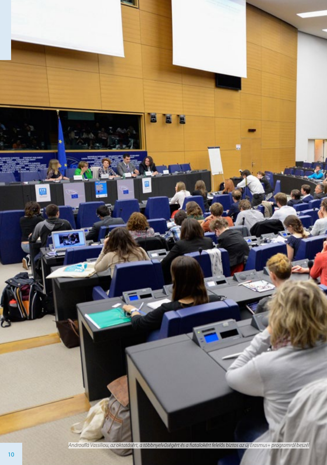
Androulla Vassiliou, az oktatásért, a többnyelvűségért és a fiatalokért felelős biztos az új Erasmus+ programról beszél