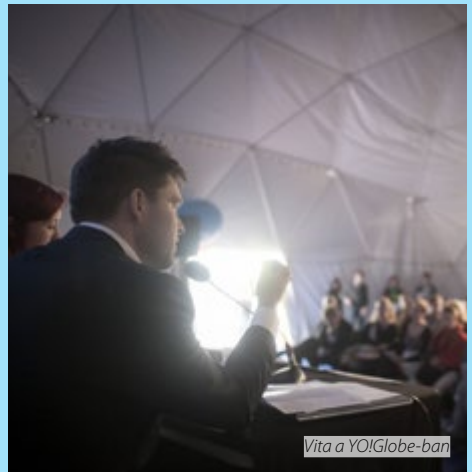
Vita a YOIGlobe-ban