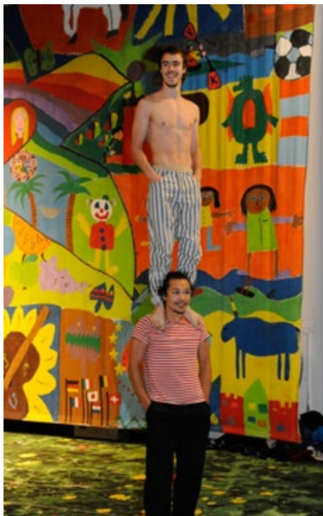
Két fiatal akrobata cirkuszi előadása

„Szerintem az oktatás révén a megkülönböztetéssel kapcsolatos bármilyen probléma megoldható. Az egész problémát az ismeretek hiánya okozza. Az oktatás révén kell elérnünk, hogy az emberek megértsék a bevándorlók valós helyzetét, és ne higgyenek annak a propagandának, amely szerint a bevándorlók