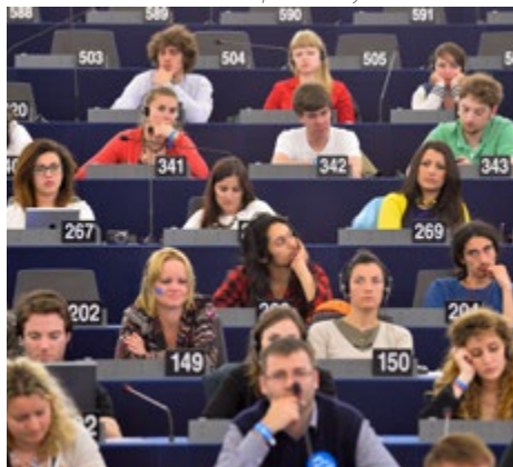
Fiatal résztvevők a képviselők helyén az üléssteremben

az információhiány jelenti – nem érzik úgy, hogy képviselnék vagy megértenék őket. Az ehhez hasonló szemináriumok tájékoztatják a fiatalokat az Unió működésének módjáról, és ez közvetlen részvétellel sarkallja őket. Ráadásul, ha már fiatalon is szavaznak, akkor nagyobb valószínűséggel tesznek ugyanígy idősebb korukban is” – fejtette ki.