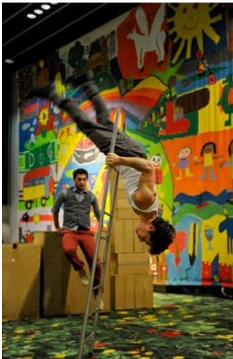
Az artistaképzők európai szövetségének (FEDEC) cirkuszelőadásai

fiatalok közötti együttműködés hiányában látja a legnagyobb a problémát.