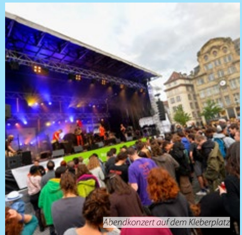
Abendkonzert auf dem Kleberplatz

Nem csak az Ifjúsági Fórum és tagjai, az Európa különböző részén működő ifjúsági szervezetek képviselik ezt a véleményt. A LoveYourFuture kampány keretében az európai parlamenti választásokon induló, különböző politikai családokból és országokból kikerülő 240 jelölt és 85 megválasztott európai parlamenti képviselő is csatlakozott több itt felvázolt elképzeléshez.