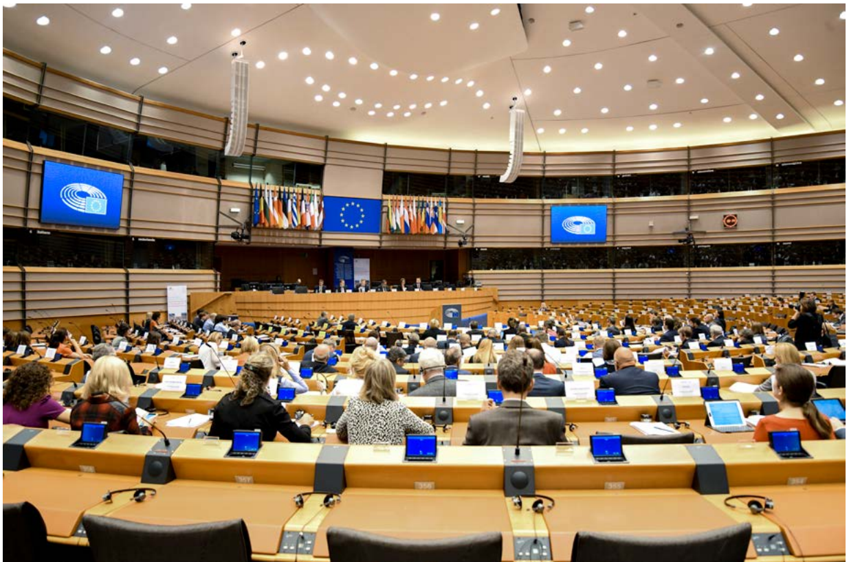
3 e réunion du GCPC d'Europol - Présentation des priorités du groupe par la troïka présidentielle 2018-2019

Le GCPC tient deux réunions par an: pendant le premier semestre de l'année, au parlement du pays qui exerce la présidence tournante du Conseil de l'Union européenne, et pendant le second semestre de l'année, au Parlement européen.