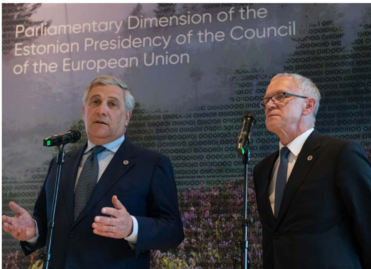
Conférence des présidents des parlements de l'Union européenne en Estonie. Antonio Tajani, président du PE, rencontre Eiki Nestor, président du Riigikogu, le parlement d'Estonie