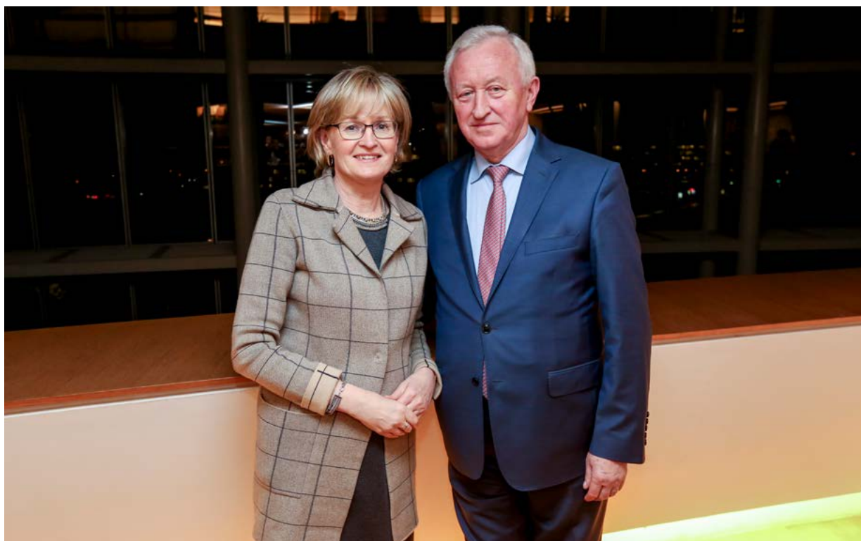
Vice-présidents Mairead McGuinness et Bogusław Liberadzki

Des questions telles que le Brexit, le budget européen, la migration, la sécurité, la politique étrangère et de défense, l'union économique et monétaire, la protection des données, l'avenir de l'alimentation et de l'agriculture et les élections européennes ont été au centre des débats lors de diverses réunions interparlementaires. Les échanges entre députés de l'ensemble de l'Union européenne sont essentiels pour la compréhension commune des problèmes et des défis, et articulent les perspectives nationales et européennes relatives à différents thèmes dans le but de trouver des solutions communes.