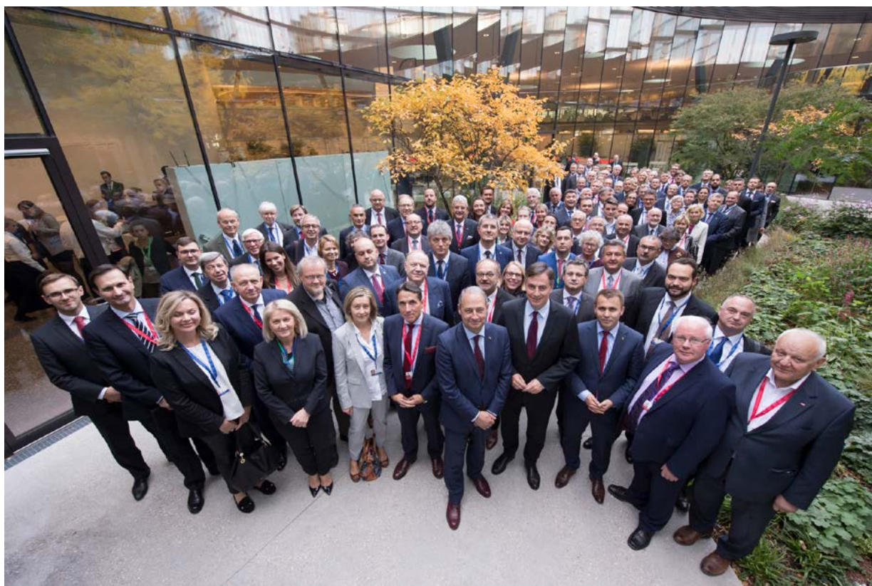
Conférence interparlementaire sur la politique étrangère et de sécurité commune et la politique de sécurité et de défense commune (conférence interparlementaire PESC/PSDC) à Vienne, les 11 et 12 octobre 2018

En 2018, les douzième et treizième éditions de la conférence interparlementaire PESC/PSDC ont eu lieu à Sofia (15 au 17 février) et à Vienne (11 et 12 octobre). Les délégations du PE aux deux réunions étaient composées de membres de la commission des affaires étrangères et de la sous-commission «sécurité et défense» et elles étaient présidées par M. David McAllister, président de la commission des affaires étrangères.