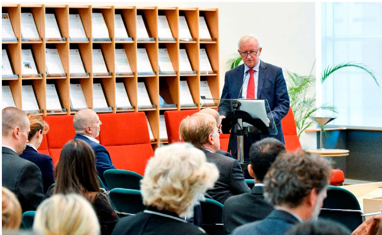
Le vice-président Bogusław Liberadzki s'exprimant lors du séminaire du CERPD en septembre

L'événement a attiré 60 participants de 28 chambres parlementaires. Le séminaire était axé sur la prestation de services aux députés dans leurs rôles multiples: à titre individuel, en tant que membres de commissions spécialisées et dans leurs activités de plus en plus nombreuses de sensibilisation.