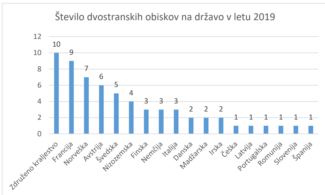
Število dvostranskih obiskov na državo v letu 2019

Obiski francoskih delegacij so bili večinoma povezani s tekočimi zakonodajnimi dosjeji EU.