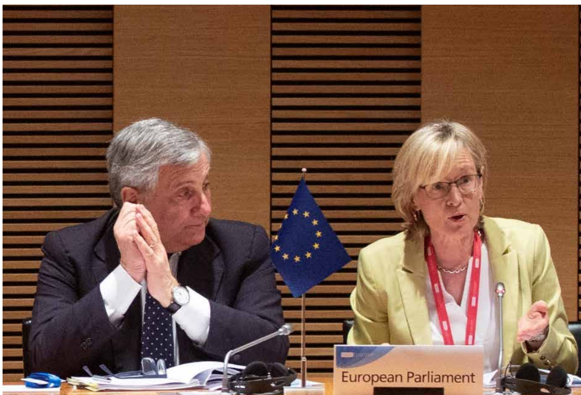
Predsednik Odbora za ustavne zadeve Antonio Tajani in prva podpredsednica Evropskega parlamenta Mairead McGuinness na srečanju predsednikov COSAC v Helsinkih 21. in 22. julija 2019