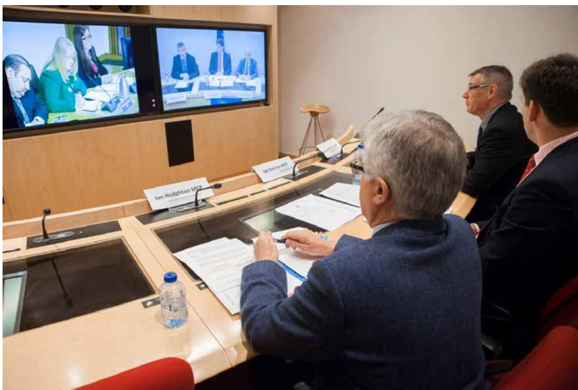
Videokonferenca v Evropskem parlamentu, ©EU-EP.

Videokonference nudijo nove možnosti in lahko olajšajo medparlamentarno sodelovanje. Evropski parlament lahko zagotovi tehnično rešitev, ki omogoča videokonference z odlično kakovostjo slike in zvoka ter tolmačenjem v več jezikov. Videokonference lahko prispevajo k rednejšemu stiku med poslanci in omogočajo skrajšanje potovalnega časa in zmanjšanje stroškov službenih potovanj ter so okolju prijazne. Skratka, so stroškovno učinkovito orodje za organizacijo sej.