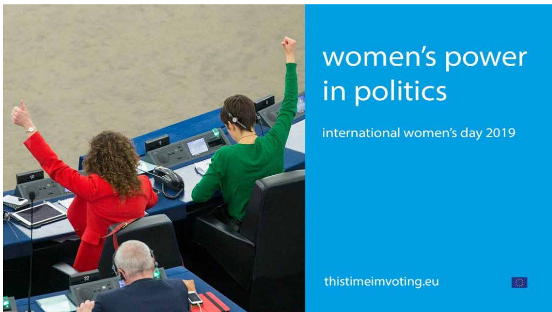
Medparlamentarna seja odborov ob mednarodnem dnevu žena 2019

Dogodek je bil osredotočen na dve temi. Na prvi okrogli mizi je bilo obravnavano vprašanje resnične moči žensk v politiki in kako jo okrepiti, na drugi pa vprašanje mladih žensk v politiki. Seja je zagotovila svetovni forum za izmenjavo izkušenj in primerov dobre prakse za spodbujanje zastopanosti žensk v politiki. Zaključne besede je pripravila podpredsednica/visoka predstavnica Federica Mogherini. Opozorila je na sedanje nazadovanje v zvezi z enakostjo spolov in dodala, da si morajo za doseg tega cilja prizadevati tudi moški.