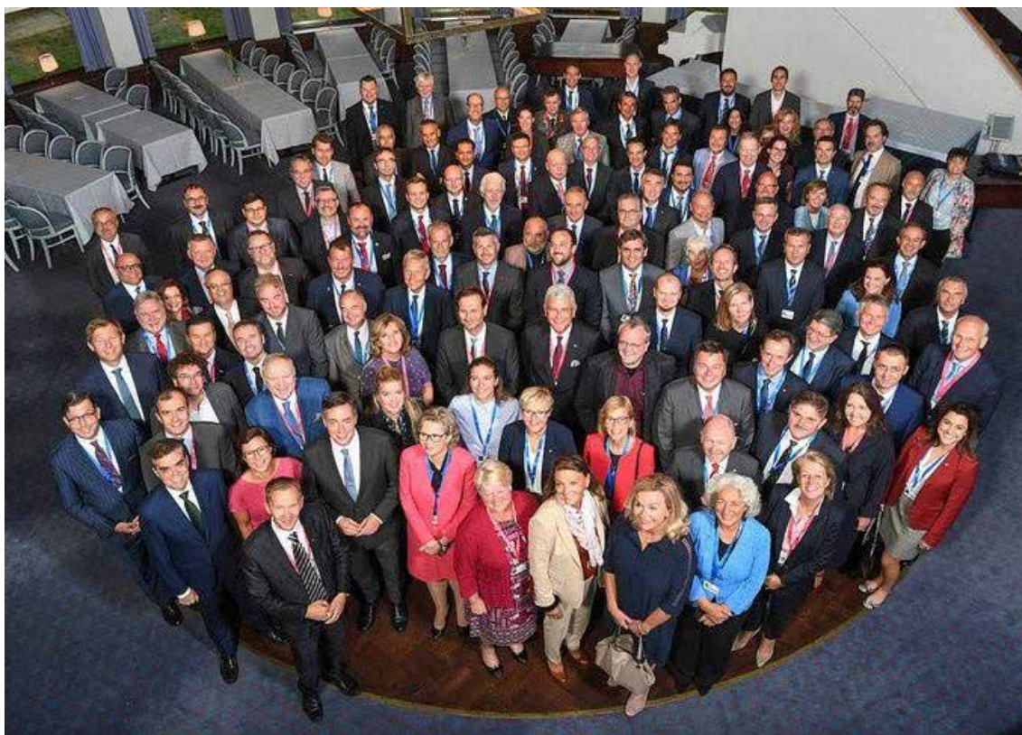
Medparlamentarna konferenca za skupno zunanjo in varnostno politiko ter skupno varnostno in obrambno politiko (MPK SZVP/SVOP) v Helsinkih, od 4. do 6. septembra 2019

Sopredsdujoči so v svoji končni izjavi opozorili, da tri četrtine državljanov v zadnjih dveh desetletjih dosledno podpira bolj skupno evropsko obrambo in da mora Evropska unija še vedno izpolniti to zahtevo. Prav tako sta podprli zamisel, da bi bilo treba sodelovanje EU na področju obrambe še naprej usklajevati z Natom. Pozdravili sta predloge predsednice Komisije Ursule von der Leyen za povečanje sredstev za zunanje delovanje v novem večletnem finančnem okviru za obdobje 2021–2027.