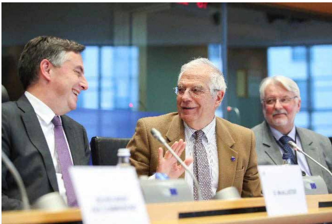
David McAllister, predsednik odbora AFET, Josep Borrell, podpredsednik/visoki predstavnik, in Witold Jan Waszczykowski, podpredsednik odbora AFET, na medparlamentarni seji odborov, ki sta jo skupaj organizirala oddelek za zakonodajni dialog in odbor AFET dne 4. decembra 2019

24. septembra 2019 je Odbor za ekonomske in monetarne zadeve (ECON) nacionalne parlamente EU povabil na medparlamentarno sejo odborov, da bi razpravljali o priporočilih za posamezne države. Razprava se je osredotočila na izvajanje prednostnih nalog evropskega semestra za leto 2019, pa tudi na prednostne naloge letnega pregleda rasti za leto 2020, ki bo osnova za evropski semester za naslednje leto.