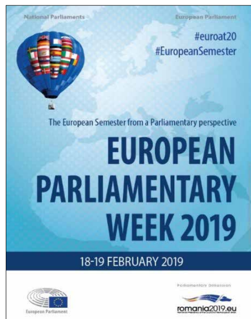
Plakat evropskega parlamentarnega tedna 2019.

Vse razprave so prispevale k povezovanju poslancev nacionalnih parlamentov EU in Evropskega parlamenta, da bi tesneje sodelovali pri vprašanjih, povezanih z evropskim semestrom.