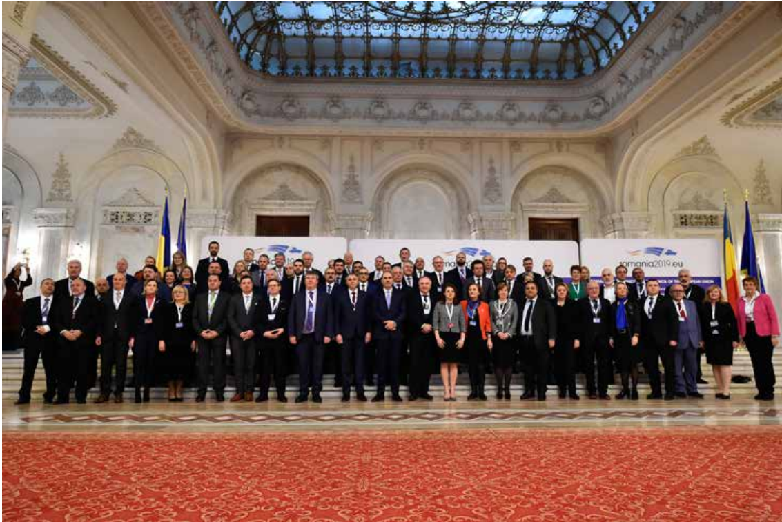
Četrto srečanje skupine za skupni parlamentarni nadzor v Bukarešti 24. in 25. februarja 2019

Dnevni redi sej skupine za skupni parlamentarni nadzor vsebujejo stalne točke, in sicer poglobljeno izmenjavo mnenj z izvršnim direktorjem Europolu o njegovih dejavnostih in izzivih ter o njegovem večletnem delovnem programu. Te izmenjave dopolnjujejo predstavitve predsednika upravnega odbora Europolu in poročilo predstavnika skupine za skupni parlamentarni nadzor za seje upravnega odbora. Drugi redni osrednji govorniki so evropski nadzornik za varstvo podatkov in predsednik odbora za sodelovanje Europolu, ki delegate obveščajo o najnovejših dogodkih na področju varstva osebnih podatkov v zvezi z dejavnostmi Europolu. Predstavitvam je sledila razprava z vprašanji in odgovori.