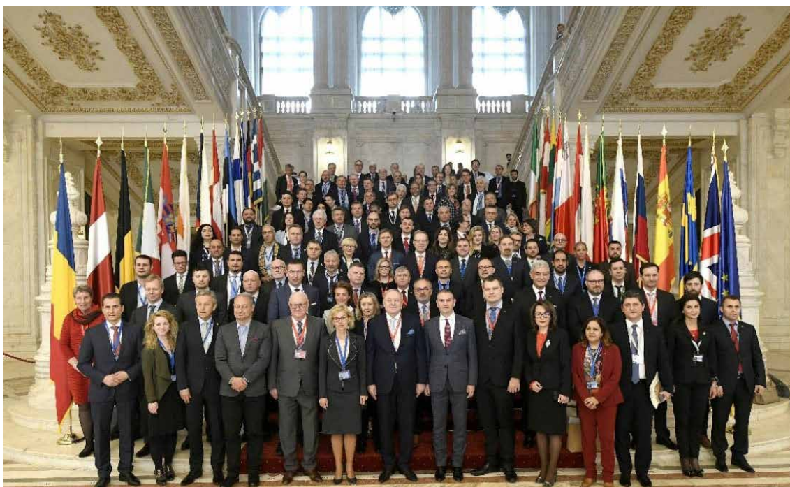
Medparlamentarna konferenca za skupno zunanjo in varnostno politiko ter skupno varnostno in obrambno politiko (MPK SZVP/SVOP) v Bukarešti, od 6. do 8. marca 2019

Poslanke so v okviru medparlamentarne konference sprejele deklaracijo ženskih evropskih poslank, ki je bila predstavljena na plenarnem zasedanju, da bi 8. marca obeležili mednarodni dan žena.