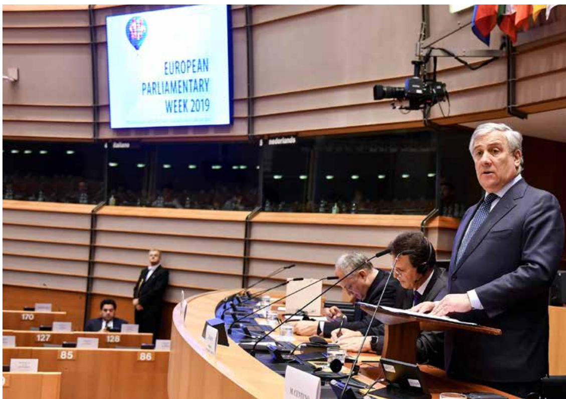
Predsednik Evropskega parlamenta Antonio Tajani je govoril na konferenci o evropskem semestru v Bruslju, 19. februarja 2019 ©EU_EP.