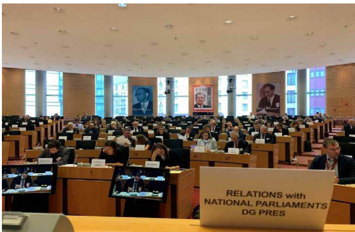
Živahna medparlamentarna razprava o evropskem semestru in njegovem vplivu na nacionalna gospodarstva

Dogodek je bil osredotočen na dve temi. Na prvi okrogli mizi je bilo obravnavano vprašanje resnične moči žensk v politiki in kako jo okrepiti, na drugi pa vprašanje mladih žensk v politiki. Seja je zagotovila svetovni forum za izmenjavo izkušenj in primerov dobre prakse za spodbujanje zastopanosti žensk v politiki. Zaključne besede je pripravila podpredsednica/visoka predstavnica Federica Mogherini. Opozorila je na sedanje nazadovanje v zvezi z enakostjo spolov in dodala, da si morajo za doseg tega cilja prizadevati tudi moški.