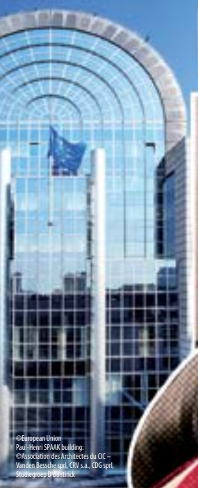
© European Union Paul-Henri SPAM building; © Association des Architectes du CIC - Vanden Bessche sprl, CRV s.a., CDG sprl, Studegroep B&B omnick