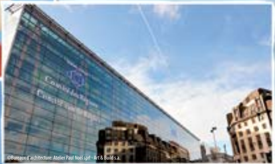
© Bureau of Architecture: Atelier Paul Noel sprl - Art & Build s.a.